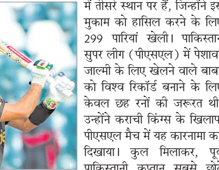
में तीसरे स्थान पर हैं, जिन्होंने इस मुकाम को हासिल करने के लिए 299 पारियां खेलीं। पाकिस्तान सुपर लीग (पीएसएल) में पेशावर जाल्मी के लिए खेलने वाले बाबर को विश्व रिकॉर्ड बनाने के लिए केवल छह रनों की जरूरत थी। उन्होंने कराची किंग्स के खिलाफ पीएसएल मैच में यह कारनामा कर दिखाया। कुल मिलाकर, पूर्व पाकिस्तानी कप्तान सबसे छोटे

नई दिल्ली (एजेंसी)। पाकिस्तान के स्टार बल्लेबाज बाबर आजम इस समय पाकिस्तान सुपर लीग में खेल रहे हैं। उन्होंने इस सीजन के दौरान टी20 क्रिकेट में इतिहास रचा और एक बड़ा रिकॉर्ड अपने नाम भी किया है। बाबर आजम बुधवार को वेस्टइंडीज के पूर्व बल्लेबाज क्रिस गेल को पीछे छोड़कर टी20 फॉर्मेट में सबसे तेज 10,000 रन बनाने वाले बल्लेबाज बन गए हैं। बाबर ने 271 पारियों में यह मुकाम हासिल किया। जबकि, क्रिस गेल को यह उपलब्धि हासिल करने में 285 पारियां लगीं। भारत के विराट कोहली इस लिस्ट