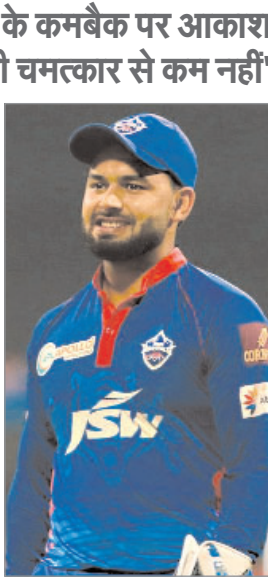
मुझे पूरा यकीन है कि उसे बहुत काम करना पड़ा होगा, वहां से यहां तक की यात्रा कठिन है।' चोपड़ा का मानना है कि पंत ने केवल खेलेंगे बल्कि कप्तान के रूप में दिल्ली कैपिटल्स का नेतृत्व भी करेंगे। बल्लेबाज के रूप में 26 वर्षीय प्लेयर की उपस्थिति दिल्ली स्थित फ्रेंचाइजी के लिए बड़ी समस्या का समाधान करेगी। पंत ने 98 आईपीएल मैचों में 34.61 की औसत और 147.97 की स्ट्राइक रेट से 2,838 रन बनाए हैं, जिसमें उनका हाईएस्ट स्कोर नाबाद 128 रन है।

नई दिल्ली (एजेंसी)। भारत के स्टार विकेटकीपर-बल्लेबाज ऋषभ पंत जल्द क्रिकेट के मैदान में दिखाई दे सकते हैं। आईपीएल 2024 में उनके संभावित कमबैक पर पूर्व भारतीय क्रिकेटर आकाश चोपड़ा ने कहा, 'यह किसी चमत्कार से कम नहीं।' 30 दिसंबर, 2022 को एक कार दुर्घटना में पंत बाल-बाल बचे थे। उस समय से लेकर अब तक वो उरुतना अच्छे नहीं चल पाया। 'गंभीर ने मुझे मैच के बाद देख लेने की धमकी दी थी : मनोज साल 2013 में विवाद इस हद तक पहुंच गया कि मनोज तिवारी को केकेआर छोड़ने पर मजबूर होना पड़ा। इस बारे में मनोज ने कहा, 'उन्होंने मुझे कहा कि तुम मैच के बाद बाहर मिलना। मैं देखूंगा तुम्हें।' इसके बाद उन्होंने कहा, 'आज आपका काम खत्म हो गया। मुझे लगता है कि उन्हें ऐसा नहीं कहना चाहिए था। कोटला में पत्रकारों का स्टैंड मैदान के अंदर है। हर कोई सबकी सुनता है। वे शब्द भी सभी ने सुने।' आईपीएल 2024 में गौतम गंभीर मॅटर के रूप में केकेआर केप मनोज ने कहा, 'गंभीर के साथ हुई लड़ाई का मुझे अब भी पछतावा है, क्योंकि मैं उस तरह का इंसान नहीं हूँ जो सीनियर्स से झगड़ता हो। उस घटना को टाला जा सकता था। सीनियर्स के साथ मेरे रिश्ते बहुत अच्छे हैं, लेकिन एक घटना की वजह से हमारी बदनामी हुई।' मनोज ने बताया, 'एक