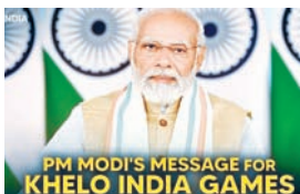
PM MODI'S MESSAGE FOR KHELO INDIA GAMES

खेलों को सेलिब्रेट करना समाज का दायित्व : प्रधानमंत्री