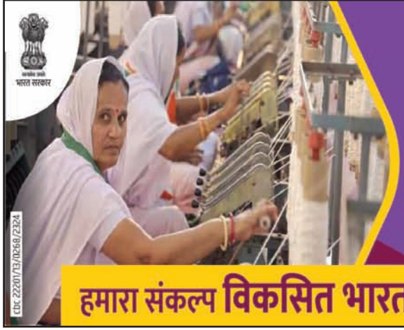
हमारा संकल्प विकसित भारत