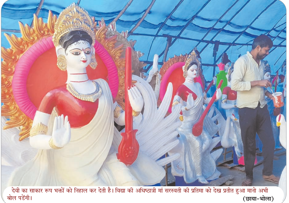
देवी का साकार रूप भक्तों को निहाल कर देती है। विद्या की अधिष्ठात्री मां सरस्वती की प्रतिमा को देख प्रतीत हुआ मानो अभी बोल पड़ेगी।

सड़कों के जीर्णोद्धार के अलावा नई सड़कों का भी निर्माण किया गया है। वहीं कई योजनाओं की स्वीकृति के बाद निविदा की प्रक्रिया चल रही है। विशेष अतिथि पूर्व