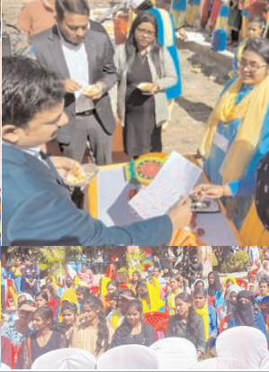
मतदान के प्रति जागरूकता लाये। पहली बार वोट करने वाली छात्रायें

डीसी ने छात्राओं से किया संवाद कार्यशाला में उपायुक्त ने कई छात्राओं से संवाद कर उनके प्रश्नों का समुचित जबाब भी दिये। इस दौरान उन्होंने छात्राओं को प्रतियोगी परीक्षाओं की तैयारी के गुर भी सिखाये।