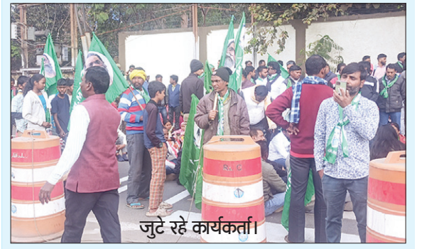
जुटे रहे कार्यकर्ता।