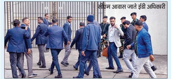
सीएम आवास जाते ईडी अधिकारी