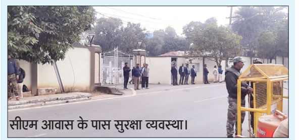
सीएम आवास के पास सुरक्षा व्यवस्था।