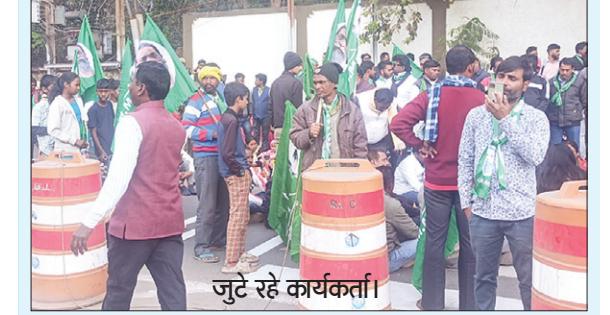
जुटे रहे कार्यकर्ता।