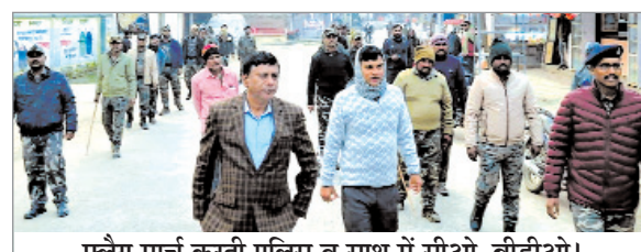
फ्लैग मार्च करती पुलिस व साथ में सीओ, बीडीओ।