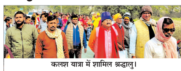
कलश यात्रा में शामिल श्रद्धालु।

नवीन मेल संवाददाता हुसैनाबाद। प्रखंड के महुअरी पंचायत के ग्राम झरहा में श्री ब्रह्म स्थान मंदिर प्राण-प्रतिष्ठा सह धार्मिक अनुष्ठान को लेकर शनिवार को बैंड बाजा व डीजे के साथ विद्वान महात्माओं के नेतृत्व में भव्य कलश जलयात्रा निकाली गयी। कलश यात्रा चिरेयाखाड़ ब्रह्म स्थान से आरंभ होकर पूरे गांव का भ्रमण करते हुए बुधुआ सोन नदी घाट पर पहुंची। जहां विद्वान पुजारियों ने वैदिक मंत्रोच्चार के साथ जलभरी कराया। जल भरकर