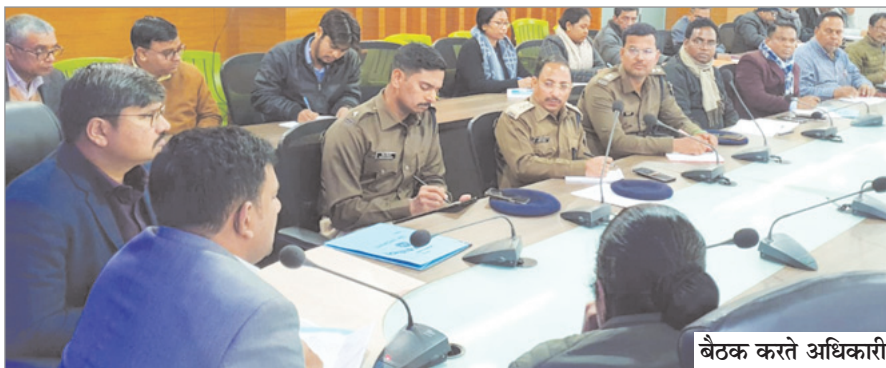
बैठक करते अधिकारी