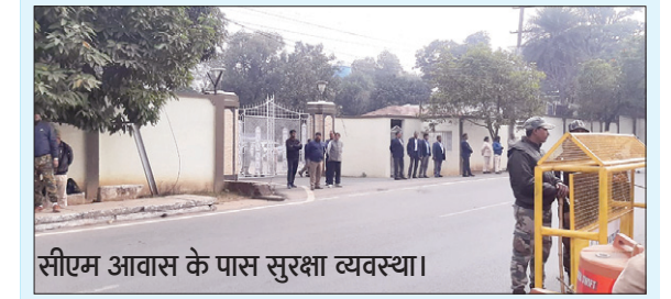
सीएम आवास के पास सुरक्षा व्यवस्था।