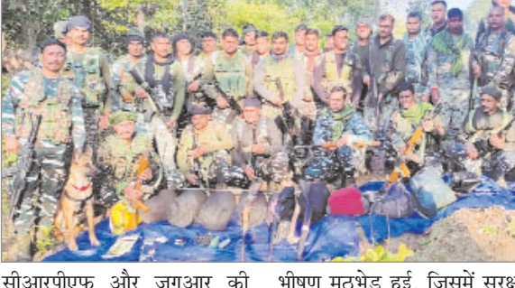
सीआरपीएफ और जगुआर की संयुक्त टीम की प्रतिबन्धित टीएसपीसी नक्सलियों के साथ

नवीन मेल संवाददाता चतरा/कुंदा। जिले के चतरा-पलामू बॉर्डर पर अहले सुबह नक्सल विरोधी अभियान पर निकली चतरा पुलिस,