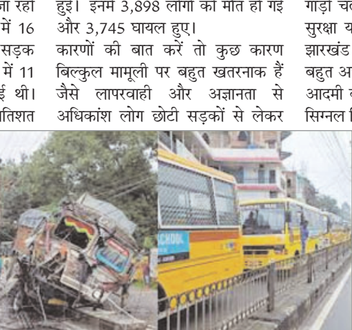
सबसे तेज गति वाले एक्सप्रेस हाइवे तक नहीं गांवों की पगडंडियों की तरह चलते ही नहीं हैं बल्कि बिना देखे सड़क पार करते हैं। ड्राइविंग लाइसेंस में अभी भले कड़ाई हुई हो पर दशकों से बिना किसी परीक्षण या प्रशिक्षण के लाइसेंस लेने वाले सिर्फ

दुर्घटनाओं में लगातार वृद्धि होती जा रही है। 2021 की तुलना में 2022 में 16 प्रतिशत दुर्घटनाएं बढ़ी हैं। यहां सड़क दुर्घटनाओं से हुई मृत्यु के मामलों में 11 प्रतिशत की बढ़ोतरी दर्ज की गई थी। जबकि घायलों की संख्या में 16 प्रतिशत की बढ़ोतरी हुई है। गत वर्ष सरकार ने इसपर सज्जान लेकर संबंधित अधिकारियों से सड़क हादसों में कमी लाने के लिए किए जा रहे प्रयासों को पूरी मुस्ती दे से करने का निर्देश दिया था। उन्होंने चिह्नित ब्लैक स्पॉट पर सुरक्षात्मक उपायों को पूरा करने, जागरूकता और यातायात नियमों की अनदेखी करने वालों के खिलाफ सख्ती करने का निर्देश दिया था। आंकड़ों की बात करें तो राज्य में 2021 में 4,728 सड़क दुर्घटनाओं में 3,513 लोगों की जानें गईं और 3,227 घायल हुए। वहीं दूसरी ओर 2022 के दौरान 5,174 सड़क दुर्घटनाएं