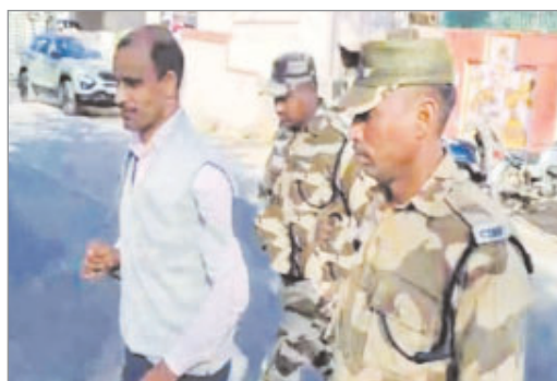
मुख्यमंत्री कार्यालय का एक कर्मी बंद लिफाफे में सीएम का जवाब लेकर ईडी कार्यालय पहुंचा था। ईडी कार्यालय के सामने उसने इस बात की पुष्टि की कि वह सीएमओ का पत्र लेकर आया है।

रांची। 1250 करोड़ रुपये के अवैध पत्थर खनन मामले में सीलबंद लिफाफे के संदर्भ में ईडी द्वारा लिखे गए कड़े पत्र का जवाब सोमवार को मुख्यमंत्री हेमंत सोरेन ने भी कड़ा रुख के साथ दिया। उन्होंने एक बार फिर से ईडी कार्यालय में जाने की हामी नहीं भरी और प्रवर्तन निदेशालय को पत्र भेजा है। केंद्रीय जांच एजेंसी ईडी साहिबगंज में हुए 1250 करोड़ रुपये के अवैध पत्थर खनन मामले में सीलबंद लिफाफे की जांच में जुटी हुई है। इस सिलसिले में बारी-बारी से लोगों को तलब किया जा रहा, उनसे पृष्ठताछ की जा रही है, कहीं-कहीं छापामारी भी जारी है। सीएम सोरेन से भी पृष्ठताछ होनी है, लेकिन अब तक आठ समन भेजे जाने के बाद भी