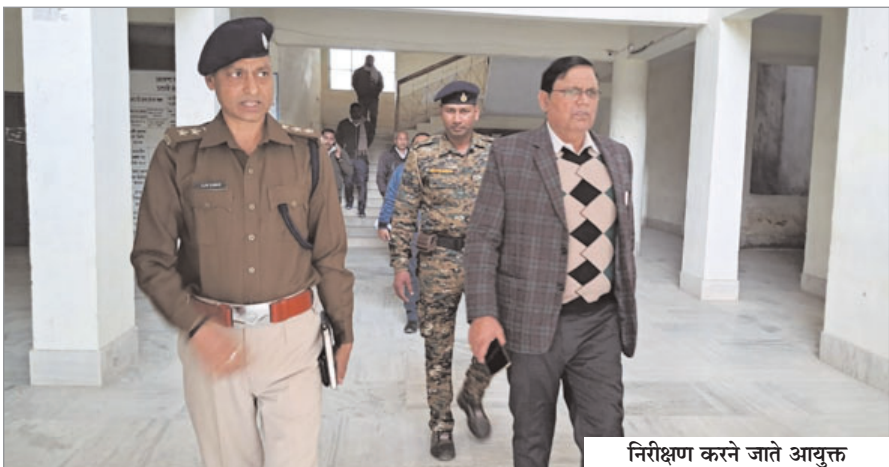
निरीक्षण करने जाते आयुक्त

आयुक्त ने छतरपुर अनुमंडल पुलिस पदाधिकारी सहित छतरपुर व हरिहरगंज के थाना प्रभारियों से विधि व्यवस्था की भी जानकारी ली।