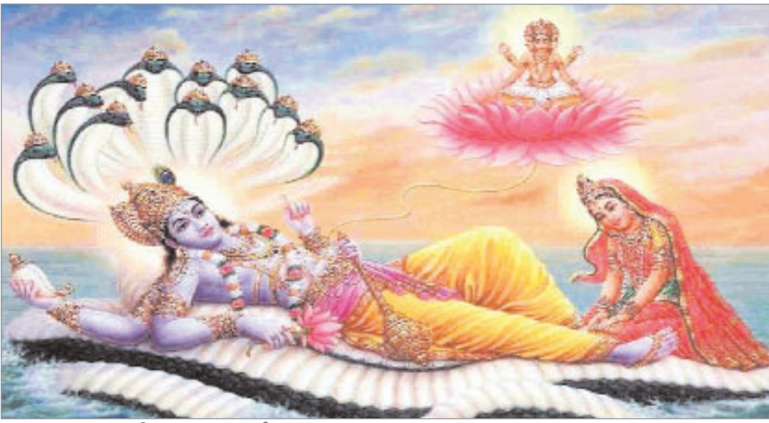
एकादशी का शुभ मुहूर्त

साल 2024 की पहली एकादशी यानी की सफला एकादशी 7 जनवरी 2024 को मनाई जाएगी। यह एकादशी सारे कष्टों को हरने वाली मानी जाती है। यह भगवान विष्णु को अति प्रिय है। भगवान विष्णु का यदि आप आशीर्वाद लेना चाहते हैं तो यह व्रत पूरी श्रद्धा के साथ करें।