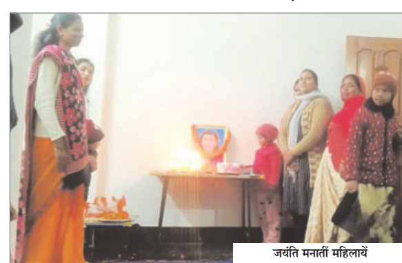
जयंती मनाती महिलायें