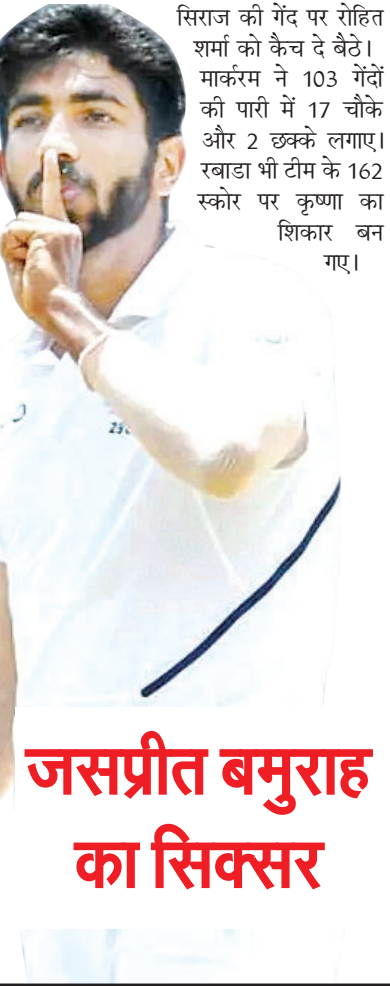
जसप्रीत बमुराह का सिक्सर

शतक बनाया लेकिन बाकी बल्लेबाजों से कोई सहयोग न मिलने के कारण दक्षिण अफ्रीका लंच तक 176 रन पर सिमट गया। हालांकि मार्करम को बुमराह की गेंद पर शतक से पहले विकेटकीपर केएल राहुल के हाथों जीवन्तान मिला लेकिन उन्होंने बुमराह पर लगातार दो चौके मारकर अपना शतक पूरा किया। तेज गेंदबाज जसप्रीत बमुराह ने 61 रन पर छह विकेट लेकर मेजबान टीम को समेटने में अहम भूमिका निभाई। बुमराह के छह विकेट के अलावा मुकेश कुमार ने 2 और मोहम्मद सिराज तथा प्रसिद्ध कृष्णा ने 1-1 विकेट लिया। दक्षिण अफ्रीका की पहली पारी 55 रन पर सिमटी थी, जबकि भारत ने 153 रन बनाकर 98 रन की बढ़त हासिल की थी। दक्षिण अफ्रीका ने कल के अपने तीन विकेट पर 66 रन के स्कोर से आगे खेलना शुरू किया। बुमराह ने दिन के पहले ही ओवर में डेविड बेंडिचम को विकेटकीपर के हाथों कैच करवाकर दक्षिण अफ्रीका पर दबाव डालने की शुरूआत की और एक के बाद एक चार विकेट लेकर मेजबान का स्कोर सात विकेट पर 111 रन कर दिया। एक छोर पर घैयं के साथ खेल रहे एडम मार्करम को कैगिसो रबाडा का अच्छा साथ मिला और उन्होंने अपने शॉट खेलते हुए शतक पूरा किया। मार्करम ने बुमराह की गेंद पर लगातार 2 चौके लगाकर शतक पूरा किया। लेकिन शतक पूरा करने के बाद मार्करम मोहम्मद