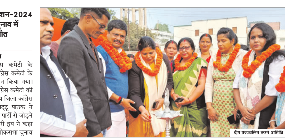
दीप प्रज्वलित करते अतिथि