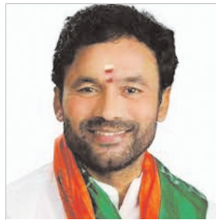
जी किशन रेड्डी

दशक पहले, विशाल वन क्षेत्र और भूमि से घिरी भौगोलिक स्थिति के साथ पूर्वोत्तर क्षेत्र की चुनौतीपूर्ण स्थलाकृति को क्षेत्र के विकास और परिवहन संपर्क के लिए एक प्राकृतिक बाधा के रूप में माना जाता था। दस साल बाद, पूर्वोत्तर क्षेत्र के जिरिबाम-इम्फाल में दुनिया का दूसरा सबसे ऊंचा रेलवे घाट पुन एक जीवंत तकनीकी चमत्कार है, जो स्थलाकृति की चुनौतियों के बावजूद निर्बाध परिवहन संपर्क की सुविधा प्रदान करता है। 2014 के बाद से, क्षेत्र की वास्तविक क्षमता का लाभ उठाने के लिए विभिन्न क्षेत्रों में 5 लाख करोड़ से अधिक खर्च किये गये हैं। प्रौद्योगिकी और डिजिटलीकरण पूर्वोत्तर क्षेत्र के समग्र विकास की रणनीति के अनिवार्य हिस्से बन गये हैं, जिनसे इस पहल को और गति मिली है। सार्वजनिक सेवा सुविधा व शासन से लेकर युवा और उद्यम तक, प्रौद्योगिकी का व्यापक उपयोग पूर्वोत्तर भारत के अमृत काल में एक नई क्रांति का वादा कर रहा है। मजबूत अवसररचना सुनिश्चित करने के लिए, सड़कों के निर्माण में नवीनतम तकनीक का प्रयोग अनिवार्य कर दिया गया है। इससे प्रतिकूल मौसम की स्थिति में भी सड़कों अधिक सुदृढ़ रहेंगी। इसके अलावा, उत्तर पूर्व अंतरिक्ष अनुप्रयोग केंद्र के तत्वावधान में सभी राज्यों में अंतरिक्ष प्रौद्योगिकी का उपयोग करते हुए कृषि और संबद्ध क्षेत्र; आपदा प्रबंधन; वन, पारितंत्र और पर्यावरण; जल संसाधन प्रबंधन; चिकित्सा और स्वास्थ्य; योजना और विकास तथा परिवहन संचार के क्षेत्र में कार्य योजनाएँ तैयार कीं हैं। कृषि और बागवानी इस क्षेत्र के दो सबसे संभावना वाले क्षेत्र हैं, जिनमें आर्थिक विकास और आजीविका सृजन की अपार संभावनाएँ हैं। अंतरिक्ष