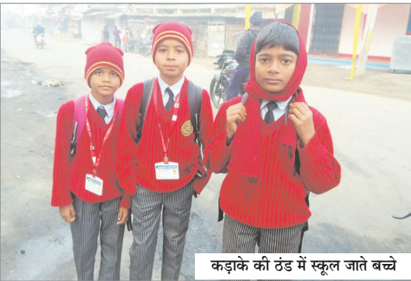
कड़के की ठंड में स्कूल जाते बच्चे

नवीन मेल संवाददाता मेदिनीनगर। पलामू में शीतलहर व धुंध का प्रकोप बढ़ता जा रहा है। इसके बाद भी स्कूल खुल जाने के कारण छोटे-छोटे बच्चों को भी ठंड