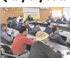
प्रशिक्षण लेते अधिकारी