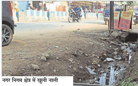
नगर निगम क्षेत्र में खुली नाली

नवीन मेल संवाददाता मेदिनीनगर। नगर निगम क्षेत्र के मुख्य चौराहों के साथ गलियों में भी जगह-जगह खुली नालियां जहां दुर्घटनाओं को दावत दे रहीं हैं। वहीं इससे मच्छरों का प्रसार बढ़ जाने से संक्रामक बीमारियों का भी गंभीर खतरा बना हुआ है। बार-बार ध्यान आकृष्ट कराने के बाद भी नालियों को ढंकवाने की दिशा में कोई पहल नहीं किये जाने से लोगों में भारी रोष व्याप्त है। मेदिनीनगर शहर के रेडमा चौक, सादिक मंजिल चौक, पंचमुहार, अस्पताल मोड़ सहित प्रमुख छहमुहान पर भी खुली नालियां सहजता से देखी जा सकती हैं। खतरनाक मोड़ पर भी नालियां ढंकी हुई नहीं होने से आये दिन