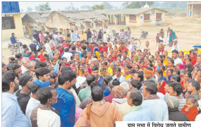
ग्राम सभा में विरोध जताते ग्रामीण