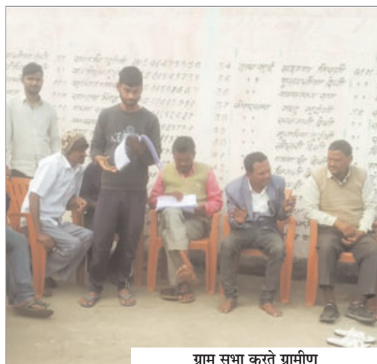
ग्राम सभा करते ग्रामीण

आक्रोशित महिलाओं ने कहा कि सूची बनाने में बगैर जांच के सक्षम लोगों का नाम शामिल कर जरूरतमंदों को इस योजना से वंचित किया जा रहा है