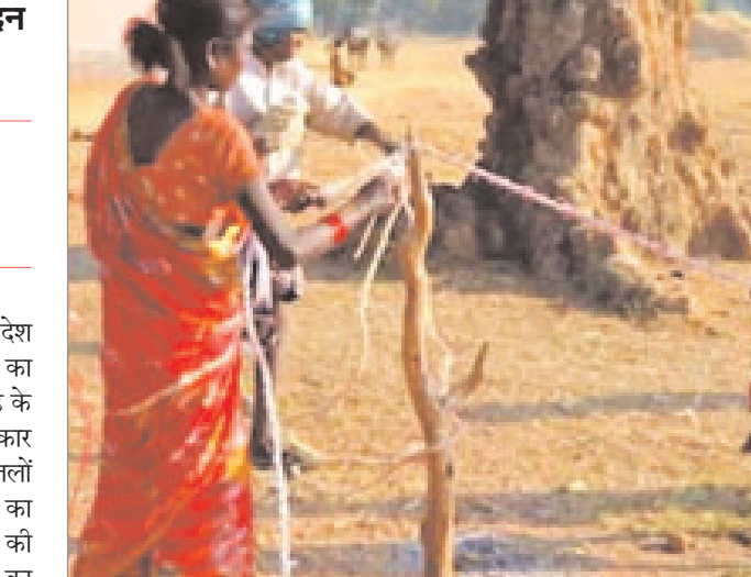
आदिम जनजाति का परिवार

नवीन मेल संवाददाता मेदिनीनगर। प्रधानमंत्री जनमन योजना के तहत देश के 101 जिलों में चले जागरूकता अभियान का मंगलवार को अंतिम दिन है। इन जिलों में झारखंड के पलामू, खुंटी व गुमला जिले शामिल हैं। भारत सरकार के आदिवासी मामलों के मंत्रालय ने सशर्त 101 जिलों के कलेक्टरों को 2 जनवरी तक जागरूकता का अभियान चलाने को निर्देशित किया था। शासन की सक्रियता से जनमन जागरूकता अभियान घर-घर का अभियान बन गया। बताते चलें कि पलामू जिले के 21 प्रखंडों में 15 प्रखंडों में जनजातीय आदिवासियों