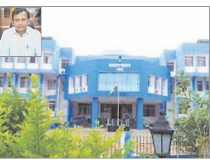
अंतर्गत निष्पादित करने का प्रावधान है, परंतु प्रायः ऐसा देखा जा रहा है कि कुछ सेवाओं को निर्धारित समय सीमा के अंदर निष्पादित नहीं किया जा रहा है। जिसके कारण लॉबि आयेदनों की संख्या बढ़ती जा रही है। इसे लेकर उन्होंने सभी संबंधितों को सेवा देने की गारंटी अधिनियम का अनिवार्य रूप से पालन करने को लेकर निर्देशित किया है। इसके अलावे उन्होंने आमजनों की सुविधा के लिए सेवाओं से संबंधित सभी प्रासंगिक सूचना कार्यालय के नोटिस बोर्ड में प्रदर्शित करने का निर्देश दिया है।

नवीन मेल संवाददाता मेदिनीनगर। जिले के उपायुक्त शशि रंजन ने पलामू के सभी कार्यालय प्रधानों को झारखंड राज्य सेवा गारंटी अधिनियम-2011 का पालन अनिवार्य रूप से करने का निर्देश दिया है। उपायुक्त ने कहा है कि सभी अवगत हैं कि झारखंड राज्य सेवा देने की गारंटी अधिनियम-2011 के तहत विभिन्न सेवाओं को निर्धारित समय सीमा के