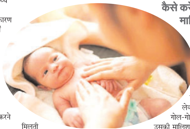
कैसे करें बच्चों की मालिश?

मिलती है। ● इसके अलावा पेट संबंधी समस्याओं से भी बच्चों को आराम मिलता है।