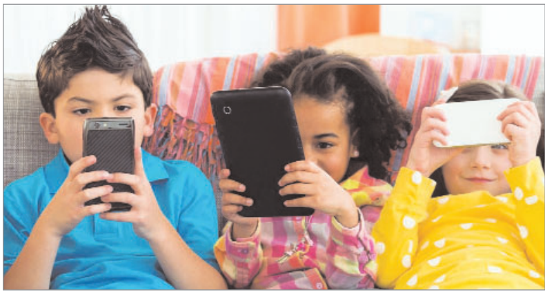
ठीक नहीं है।

हले जमाने में जहां बच्चे खिलौने से खेलना पसंद करते थे आज वहीं बदलते समय और तकनीक के साथ बच्चों के हाथों में मोबाइल की जगह फोन दिख रहे हैं। स्मार्टफोन, टीवी, लैपटॉप जैसी चीजों के बच्चे इतने ज्यादा आदि हो गए हैं कि इसके कारण उन्हें मोटापा, डिप्रेशन, कमजोर आईसाइट जैसी समस्याएं हो रही हैं। हालांकि इन सभी में बच्चों के साथ-साथ कहीं न कहीं परेंट्स भी जिम्मेदार हैं। क्योंकि परेंट्स अपने बच्चों से ही कई सारी बातें सीखते और करते हैं। आज आपको कुछ ऐसी गलतियां बताते हैं जिनके कारण आपके बच्चे फोन के आदि हो रहे हैं। ज्यादा फोन इस्तेमाल करना यदि आप खुद फोन ज्यादा इस्तेमाल करते हैं तो बच्चों को फोन से कैसे दूर रख सकते हैं। क्योंकि आपको देखकर ही बच्चे अच्छी और बुरी आदतें सीखेंगे। यदि आप खुद सोशल मीडिया पर एक्टिव रहते हैं या फिर बच्चों के सामने फोन का इस्तेमाल करते हैं तो बच्चे भी ऐसे ही करेंगे। ऐसे में यदि आप चाहते हैं कि बच्चे फोन से दूर रहे हैं तो उन्हें फोन देने का एक समय रखें। जब बच्चे आपके आस-पास हों तो उन्हें समय दें और फोन को एक तरफ रख दें। खुद फोन दे देना एक्सपर्ट्स की मानें तो बच्चे को किसी भी चीज से दूर रखने के लिए उसे लालच देना