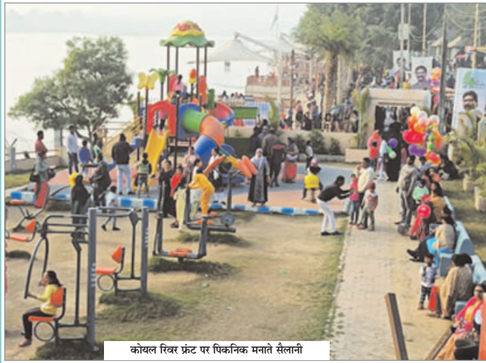
कोयल रिवर प्रंट पर पिकनिक मनाते सैलानी