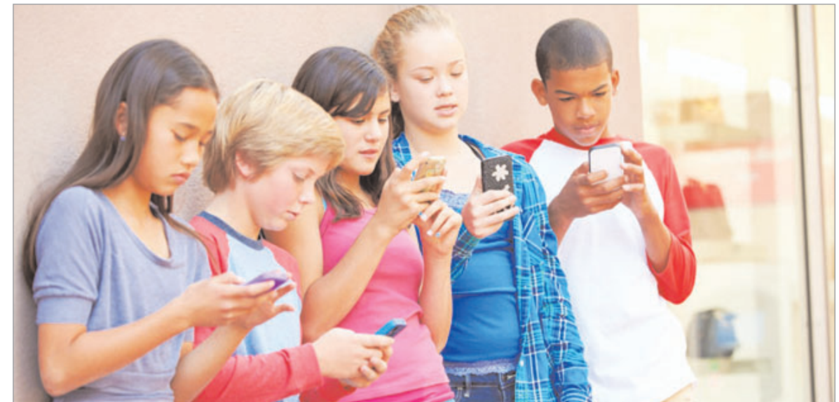
अधिकारों के प्रति उसकी जागरूकता से जोड़कर देखा जाता है, लेकिन लखनऊ की यह किशोरी जिस शिकायत का लेकर थाने पहुँच गई वह अनेक चिंताजनक सवाल खड़े करता है एवं नये बनते सामाजिक सोच की परते उधेड़ता है। बालिका का तर्क है कि माता-पिता मेरी जिंदगी में क्यों दखल दे रहे हैं। हमारे अनुभव हमारी सोच को गहरे प्रभावित करते हैं। हमारे मूल्य और आदर्श भी इससे प्रभावित होते हैं। नित नये अनुभव हमारे नजरिये में बदलाव करते रहते हैं। अगर निरपेक्ष होकर देखें तो पाएंगे कि कुछ सालों पहले आप जैसे थे, आपकी पारिवारिक दुनिया जितनी खुशनुमा थी, आज उतनी नहीं है। हम अपने स्व को भूल रहे हैं, अपनी संस्कृति एवं पारिवारिक संरचना से दूर होते जा रहे हैं। अजीब हालात है कि दूसरों की