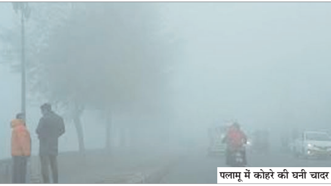
पलामू में कोहरे की घनी चादर

नवीन मेल संवाददाता मेदिनीनगर। जिले में शीतलहर का कहर जारी है। लोग धूप सेकने के लिये तरस रहे हैं। तीन दिनों के उपरिंत सोमवार दोपहर बाद कोहरे की घनी चादर में लिपटे सूर्यदेव ने दर्शन तो दिया, लेकिन उनका तेज शीतलहर के समक्ष बेअसर रहा। पलामू में मौसम का मिजाज पूरी तरह से बिगड़ा हुआ है। दिनभर घनी धुंध के साथ तेज सर्द हवाओं से कनकनी बढ़ी हुयी है। सूर्यास्त