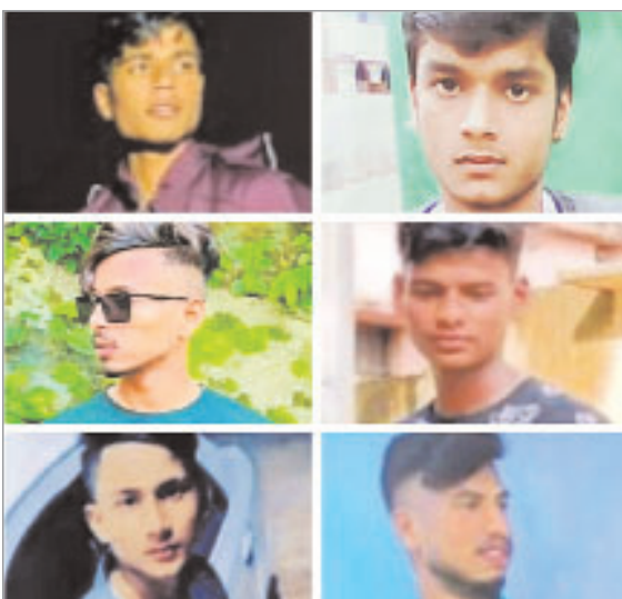
अनियंत्रित कार की पोल से सवार आठों युवक गंभीर रूप से टक्कर हो गई, जिससे कार में घायल हो

सरायकेला। नए साल का पहला दिन सरायकेला-खरसावां जिला के तहत आदित्यपुर के बाबाकुटी आश्रम के लोगों के लिए मामूला भरा रहा। सोमवार को तड़के बिष्टुपुर थाना के साईं मॉरिंग गोल चक्कर के समीप सड़क दुर्घटना में आदित्यपुर के आरआईटी थाना क्षेत्र के तहत बाबाकुटी के छह युवकों की मौत हो गई। पुलिस के अनुसार नव वर्ष पर एक डेडिंगो कार पर सवार आठ युवक पिकनिक मनाने मरीन ड्राइव की ओर जा रहे थे। इसी दौरान