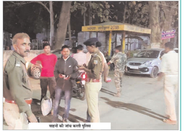
वाहनों की जांच करती पुलिस