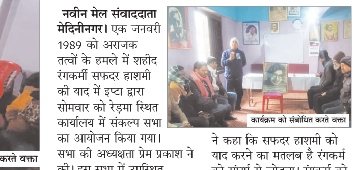
कार्यक्रम को संबोधित करते वक्ता