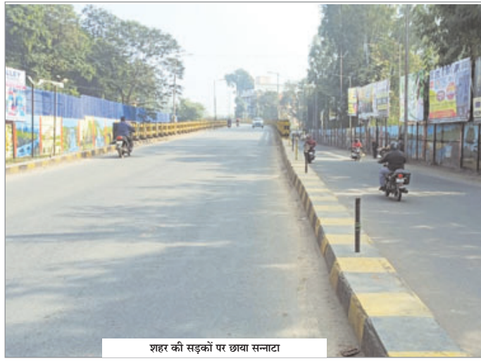
शहर की सड़कों पर छाया सन्नाटा