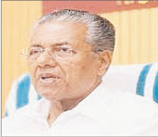
कुमार ने शुक्रवार को कांग्रेस (एस) के कदनप्पल्ली रामचंद्रन के साथ शपथ ली और

एजेंसी तिरुवनंतपुरम। पिनाराई विजयन सरकार के लिए नए साल की शुरुआत खराब रही है। नवनियुक्त राज्य परिवहन मंत्री केबी गणेश कुमार ने निवर्तमान मंत्री एंटीनी राजू की आलोचना की है। कुमार केरल कांग्रेस (बी) से हैं, जबकि राजू जनाधिपति केरल कांग्रेस से हैं। सत्तारूढ़ वाम मोर्चे में एक समझौते के तहत राजू ने कुमार के लिए परिवहन मंत्री का पद खाली कर दिया था क्योंकि 30 महीने के बाद केवल एक विधायक वाली पार्टियों को ऐसी ही दूसरी पार्टियों के लिए पद खाली करना था। इस प्रकार,