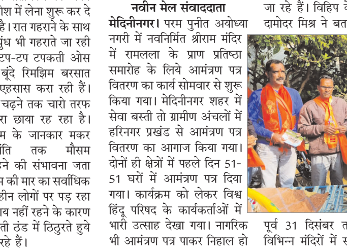
आमंत्रण पत्र देते विहिप के पदाधिकारी