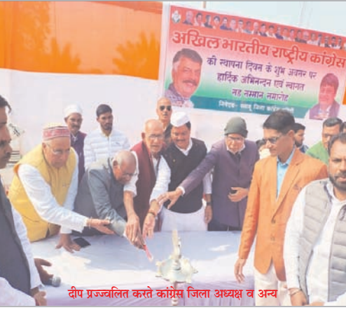
दीप प्रज्वलित करते कांग्रेस जिला अध्यक्ष व अन्य

कांग्रेस के बिना भारत का इतिहास व विकास अधूरा है। देश की आजादी के संघर्ष में कांग्रेस के योगदान को कभी भुलाया नहीं जा