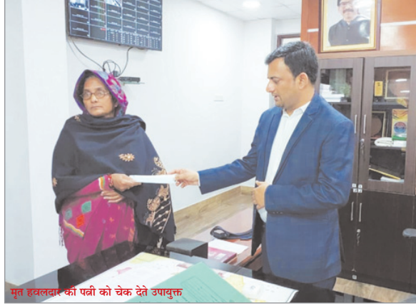
पुनः हवलदार की पत्नी को चेक देते उपायुक्त