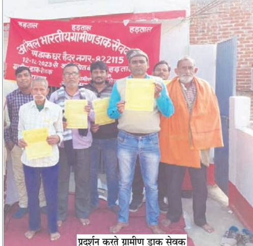
प्रदर्शन करते ग्रामीण डाक सेवक

नवीन मेल संवाददाता हुसैनाबाद। अखिल भारतीय ग्रामीण डाक सेवक संघ के आह्वान पर हैदरनगर उप डाकघर अंतर्गत 13 शाखाओं में कार्यरत ग्रामीण डाक सेवक मंगलवार से अनिश्चितकालीन हड़ताल पर चले गये हैं। इससे इन शाखा डाकघरों में ताला लटक गया है। जिससे नागरिकों को भारी परेशानी का सामना करना पड़ रहा है। पहले दिन स्थानीय उप डाकघर में ग्रामीण डाक