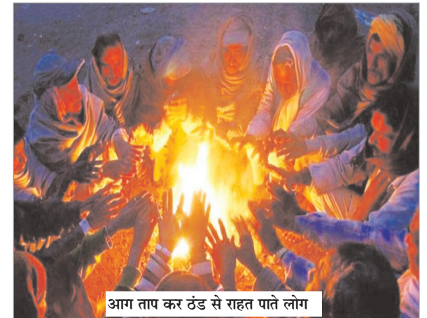
आग ताप कर ठंड से राहत पाते लोग

नवीन मेल संवाददाता मेदिनीनगर। आसमान से बादल छटते ही न्यूनतम तापमान में गिरावट दर्ज की गई है। जिले का न्यूनतम तापमान 10 डिग्री पर पहुंच जाने से ठंड में व्यापक दर्ज किया गया है। उपायुक्त ने सार्वजनिक स्थलों पर अलाव का प्रबंध करने का पदाधिकारियों को दिये निर्देश इससे जिले में कड़ाके की ठंड का दौर शुरू हो गया है। नतीजा गरीबों व राहगीरों की परेशानी बढ़ गई है। इसे लेकर राष्ट्रीय नवीन मेल के सोमवार के अंक में ठंड से राहगीरों व यात्रियों को हो रही परेशानी संबंधी खबर को प्रमुखता से प्रकाशित किया गया। 'अलाव नहीं जलने से कड़ाके की ठंड में ठिठुर रहे लोग' शीर्षक से छपी खबर को संज्ञान में लेते हुये जिले के उपायुक्त ने सभी सार्वजनिक स्थलों पर अलाव की व्यवस्था करने का