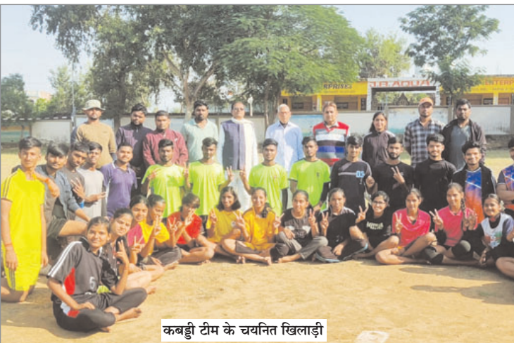
कबड्डी टीम के चयनित खिलाड़ी