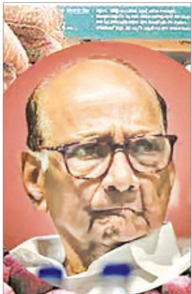
राजमार्ग पर सड़क जाम किया और सरकार विरोधी नारे लगाने वाले किसानों के धरना-प्रदर्शन में शामिल हुए।

एजेंसी। नासिक (महाराष्ट्र) प्याज उत्पादकों के हित में चार साल बाद फिर से सार्वजनिक आंदोलन शुरू करते हुए राष्ट्रवादी कांग्रेस पार्टी के अध्यक्ष शरद पवार ने कहा कि जब तक आप सड़क पर नहीं उतरेंगे, सरकार नहीं सुनेगी। उन्होंने प्याज निर्यात पर केंद्र के प्रतिबंध को रद्द करने की मांग की। पवार, राज्य में प्याज उगाने वाले केंद्रों में से एक, नासिक के चंदवाड गाँव और एक विरोध मार्च में शामिल हुए, यहाँ मुंबई-आगरा राष्ट्रीय राजमार्ग पर सड़क जाम किया और सरकार विरोधी नारे लगाने वाले किसानों के धरना-प्रदर्शन में शामिल हुए।