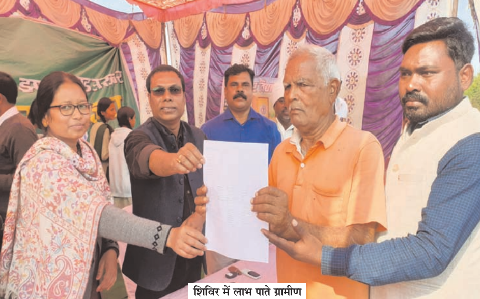
शिविर में लाभ पाते ग्रामीण

नवीन मेल संवाददाता मेदिनीनगर। आपकी योजना-आपकी सरकार-आपके द्वार अभियान को लेकर लोगों में उत्साह का माहौल कायम है। कार्यक्रम के 18वें दिन सोमवार को भी जिले के कई प्रखंडों में शिविर लगाकर लोगों को विभिन्न योजनाओं से जोड़ा गया। प्रशासनिक सूत्रों के अनुसार 24 नवंबर से लगाये जा रहे शिविर के दौरान अब तक विभिन्न योजनाओं से संबंधित 1,53,658 आवेदन आये हैं। इनमें 6572 आवेदनों का ऑन स्पॉट निष्पादन कर दिया गया है। जबकि 136 आवेदन निरस्त किये गये हैं। जानकारी के अनुसार अब तक के आयोजित शिविरों में अबुआ आवास के सर्वाधिक 99273, सावित्री बाई