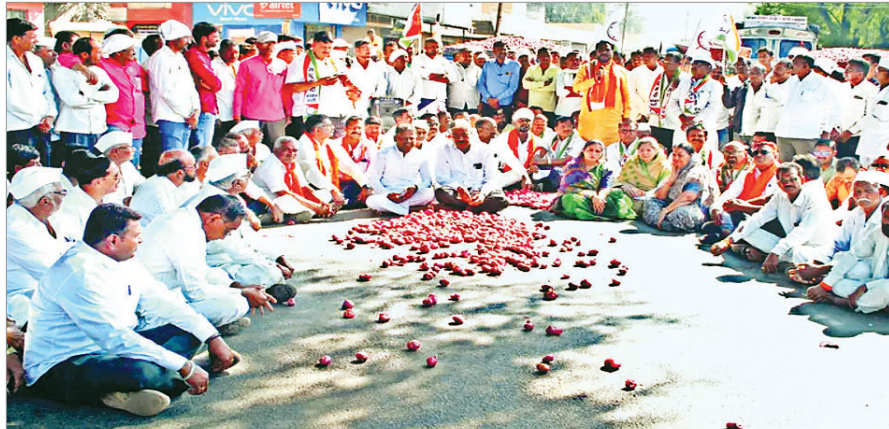
हए। पवार ने कहा की, "केंद्र के प्याज निर्यात पर प्रतिबंध के बाद देश में इसकी कीमतें गिर गई हैं... इससे किसान समुदाय में गुस्सा है। सरकार की नीतियों के कारण किसानों को उनकी मेहनत का मूल्य नहीं मिल पा रहा है।" मराठा नेता ने इसे 'दुर्भाग्यपूर्ण' बताते हुए स्पष्ट किया, "हमें इस तरह के आंदोलन करने में

कोई दिलचस्पी नहीं है, लेकिन जब तक आप सड़कों पर नहीं उतरेंगे, सरकार आपको समस्याओं पर ध्यान नहीं देगी।" पवार ने याद किया कि जब वह (मई 2004-मई 2014 तक) कृषि मंत्री थे, तो उन्होंने स्पष्ट रूप से आश्वासन दिया था कि प्याज की कीमतें गिरने नहीं दी जाएंगी, लेकिन वर्तमान सरकार ऐसा करने में सक्षम नहीं है। उन्होंने सरकार पर मार्च 2024 तक प्याज के निर्यात पर प्रतिबंध लगाकर किसानों का मजाक उड़ाने का आरोप लगाया, जिससे बाजारों में कीमतों पर नकारात्मक प्रभाव पड़ा और उत्पादकों के लिए बर्बादी हुई। पवार ने घोषणा की, यह प्रतिबंध हटाया जाना चाहिए।