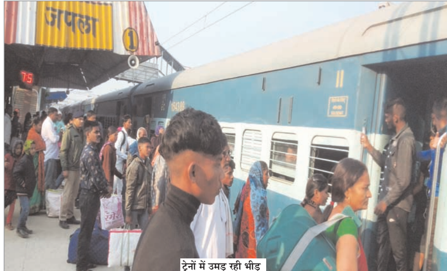
ट्रेनों में उमड़ रही भीड़