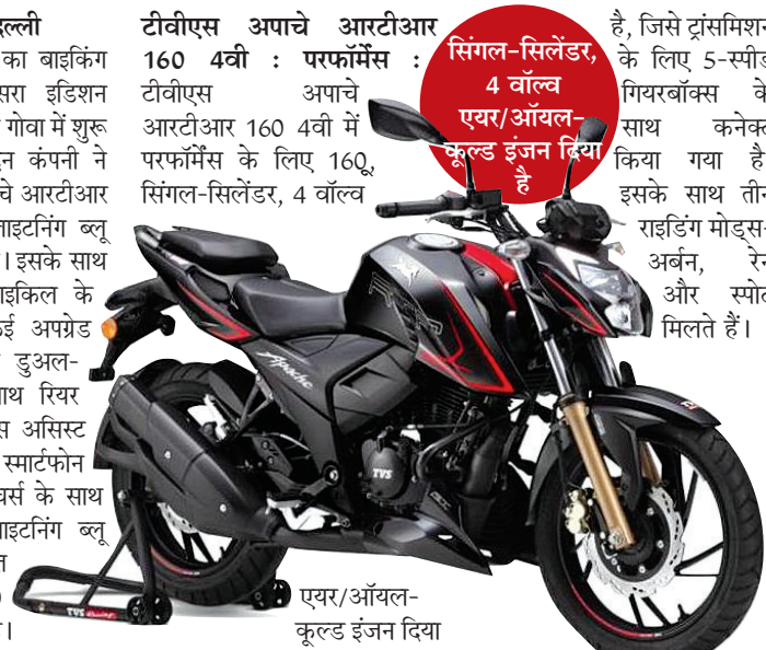
एवर/ऑयल-कूल्ड इंजन दिया

टीवीएस अपाचे आरटीआर 160 4वीं : परफॉर्मेंस : सिंगल-सिलेंडर, 4 वाल्व गियरबॉक्स के साथ कनेक्ट किया गया है। इसके साथ तीन राइडिंग मोड्स-अर्बन, रेन और स्पोर्ट मिलते हैं।