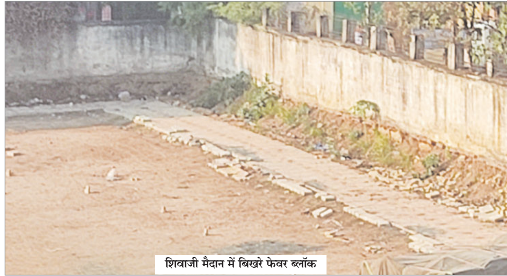
शिवाजी मैदान में बिखरे फेवर ब्लॉक

मेदिनीनगर। नगर निगम द्वारा तीन माह पूर्व शहर के प्रमुख पार्क शिवाजी मैदान में लाखों रुपए की लागत से स्थापित किये गये फेवर ब्लॉक उखड़कर पूरी तरह से क्षतिग्रस्त हो गये। नगर निगम की कार्यशैली पर सवालिया निशान लगाते हुये नागरिकों ने गहरा रोष जताया है। मेदिनीनगर शहर के मध्य स्थित शिवाजी मैदान में नियमित रूप से मार्निंग व इवनिंग वाक के लिए नागरिकों की भारी भीड़ जुटती है। टहलने वालों को समुचित सुविधा हो इसलिए नगर निगम द्वारा अगस्त महीने में ही मैदान के चारों ओर फेवर ब्लॉक लगाया गया। टहलने आने वालों को लगा कि अब उन्हें राहत मिलेगी, किंतु तीन महीने में ही तब उनकी खुशी काफूर हो गयी। जब मैदान में लगाए गये सभी फेवर ब्लॉक उखड़ गये। जिससे टहलने वालों की परेशानी भी