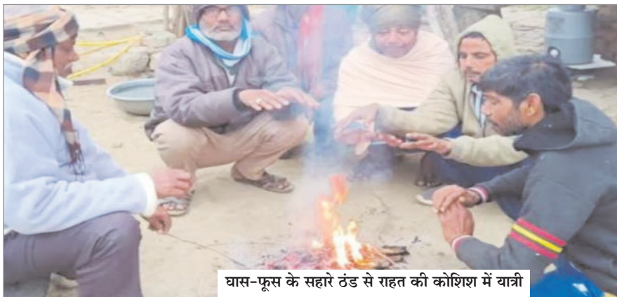
घास-फूस के सहारे ठंड से राहत की कोशिश में यात्री

नवीन मेल संवाददाता मेदिनीनगर। कड़के की ठंड शुरू हो जाने के बाद भी अभी तक शहर के किसी भी चौराहे पर अलाव का प्रबंध नहीं होने से नागरिकों विशेषकर यात्रियों व राहगीरों को भारी परेशानी का सामना करना पड़ रहा है। लोगों का कहना है कि डेढ़ वर्ष से अधिक समय से नगर निकायों का चुनाव लंबित है। ऐसे में जन प्रतिनिधि विहीन प्रदेश के नगर निकाय अधिकारियों की कृपा