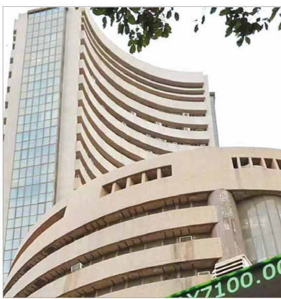
226.6 प्रतिशत, पीएफसी ने 217.2 प्रतिशत, मझगांव डॉकयार्ड ने 210 प्रतिशत, ओडिशा मिनरल ने 194.5 प्रतिशत, आईआरएफसी 187.9 प्रतिशत, इरकॉन इंटरनेशनल ने 187.1 प्रतिशत, सीपीसीएल ने 185.8 प्रतिशत और रेलटेल कॉर्प ने 184 प्रतिशत का बंपर रिटर्न निवेशकों को दिया है।

एजेंसी। नई दिल्ली वित्त वर्ष 2023-24 का शुरूआत से ही भारतीय बाजार में तेजी देखी जा रही है। इसका फायदा सरकार की लिस्टेड 85 कंपनियों को भी पूरी तरह से मिला है। इस वजह से केंद्र सरकार द्वारा नियंत्रित कंपनियों का मार्केट कैप रिकॉर्ड 17 लाख करोड़ रुपये बढ़कर 46 लाख करोड़ रुपये हो गया है। लिस्टेड 85 सरकारी कंपनियों में से 83 कंपनियों ने सकारात्मक रिटर्न निवेशकों को दिया है। केवल पावरग्रिड इन्फ्रा और इंदरप्रस्थ गैस ने ही -21.71 प्रतिशत और -6.27 प्रतिशत का नकारात्मक रिटर्न दिया है, जबकि 29 सरकारी कंपनियों ऐसी हैं, जिन्होंने निवेशकों को 100 प्रतिशत से ज्यादा का रिटर्न दिया है। 2023-24 का शुरूआत से लेकर अब तक एफएसीटी ने 269.4 प्रतिशत, आरईसी ने 251.4 प्रतिशत, आईटीआई ने