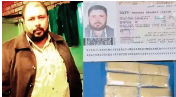
बरामदगी के इन अलग-अलग मामलों में कुल आठ लोगों को गिरफ्तार किया गया है। सोने की इस तस्करी में अभी पुलिस की तलाशी और छापेमारी पूरी भी नहीं हुई थी कि शुक्रवार को चीन से सड़क मार्ग से लाया गया 2 किलो सोना पकड़ा गया था। पुलिस ने नेपाली नागरिक

एजेंसी। काठमांडू नेपाल में 24 घंटे के भीतर तस्करी करके लाया गया 30 किलो सोना बरामद किया गया है। इसमें से 14 किलो सोना दुबई से विमान के जरिये और 2 किलो चीन से सड़क मार्ग के रास्ते लाया गया था। 6 किलो सोना इजिप्ट के नागरिक के पास से त्रिभुवन विमानस्थल पर बरामद किया गया। इसी नागरिक को निशानदेही पर काठमांडू के न्यूरोड की एक दुकान से तस्करी करके लाया गया 8 किलो सोना बरामद किया गया है। सोने की