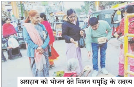
असहाय को भोजन देते मिशन समृद्धि के सदस्य