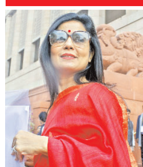
एजेंसी। नई दिल्ली