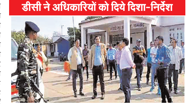
डीसी ने अधिकारियों को दिये दिशा-निर्देश राष्ट्रीय राज मार्ग से दुगापुर एयरपोर्ट के लिए रवाना होंगे। इसी को लेकर जिला प्रशासन निरीक्षण कर तैयारी का जायजा ले रहा है।

नगर आयुक्त, सहायक नगर आयुक्त, ट्रैफिक डीएसपी, डीएसपी अमर पांडे, धनबाद थाना प्रभारी, बरवाअब्दु थाना प्रभारी, पथ निर्माण विभाग सहित सभी संबंधित विभाग के अधिकारी मौजूद थे। डीसी वरुण रंजन और एसएसपी संजीव कुमार ने बताया कि उपराष्ट्रपति के कार्यक्रम को लेकर सुरक्षा व्यवस्था और तैयारी का जायजा लिया जा रहा है। अवैध कट और सड़क की बरिक्तियों सहित अन्य पहलुओं की जांच की जा रही है। पथ निर्माण विभाग, निगम सहित सभी संबंधित अधिकारियों को आवश्यक दिशा-