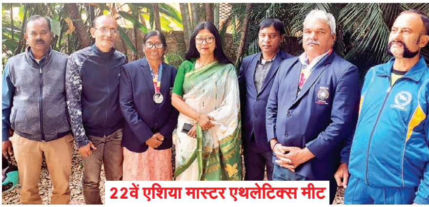
22वें एशिया मास्टर एथलेटिक्स मीट

सिंगल आया। अर्शदीप पर आउट हुए। रिकू सिंह ने आखिरी गेंद पर छक्का जड़ा। आखिरी ओवर में 3 गेंद पर 3 विकेट गिरने से मैच रोमांचक हो गया था। हालांकि, सीन एवॉट ने नोबॉल भी कर दिया था। हालांकि, सीन एवॉट ने नोबॉल कर दिया था। इसके कारण रिकू का छक्का काउंट नहीं हुआ।