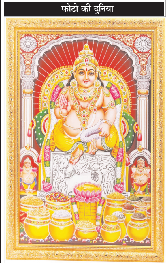
फोटो की दुनिया

से 36 घंटों में डीपफेक से जुड़े फोटो और वीडियो को हटाने का निर्देश दिया गया है। डीपफेक वीडियो को फेशियल एक्सप्रेशन से पहचाना जा सकता है। फोटो और वीडियो के आईज्रो, लिप्स को देखकर और उसके मूवमेंट से भी पहचान की जा सकती है। साथियों बात कर हम डीपफेक के संबंध में माननीय पीएम के विचारों की करें तो, उन्होंने शुक्रवार को कहा था कि कृत्रिम मेथा (एआई) का इस्तेमाल 'डीप फेक' बनाने के लिए किया जाना चिंताजनक है। साथ ही उन्होंने मीडिया से इसके दुरुपयोग और प्रभाव के बारे में जागरूकता फैलाने का आग्रह किया था।