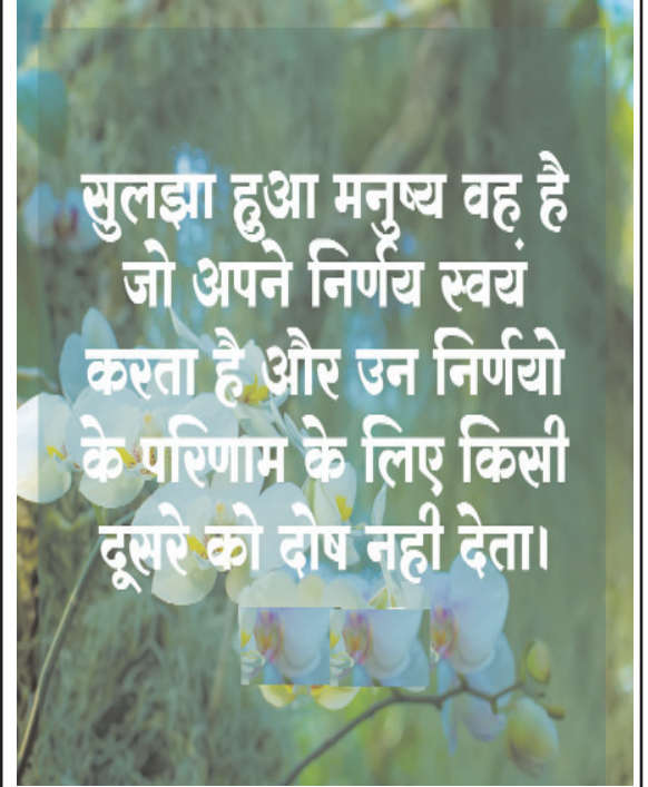
फेसबुक वॉल से