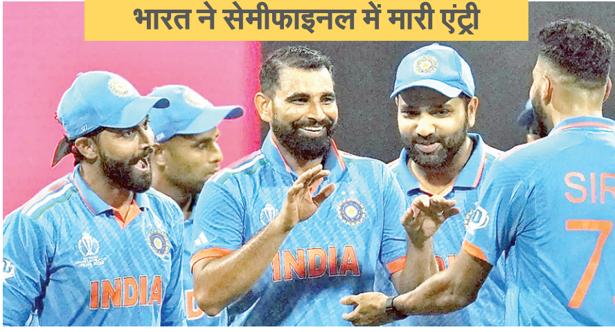
भारत ने सेमीफाइनल में मारी एंट्री

एजेंसी। मुंबई भारत ने क्रिकेट वर्ल्ड कप में श्रीलंका को जीत के लिए 358 रन का लक्ष्य दिया था। जवाब में श्रीलंका की पूरी टीम 19.4 ओवर में 55 रन पर सिमट गई और भारत ने 302 रन से यह मुकामबाला अपने नाम किया। यह भारत की वर्ल्ड कप इतिहास में सबसे बड़ी जीत है। साथ ही वर्ल्ड कप 2023 में टीम इंडिया सेमीफाइनल में पहुंचने वाली पहली टीम भी बन गई है। मुंबई के वानखेड़े स्टेडियम में टीम इंडिया की बादशाहत श्रीलंका के खिलाफ कायम रही। पहले भारतीय बल्लेबाजों ने श्रीलंकाई गेंदबाजों की जमकर धुलाई की। फिर, भारतीय गेंदबाजों ने भी अपना जादू बिखेरा। भारत ने पहले बल्लेबाजी करते हुए 8 विकेट पर 357 रन बनाए। जवाब में भारतीय गेंदबाजों ने श्रीलंका को 19.4 ओवर में 55 रन