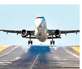
में कहा कि क्रू मेंबर का कोई भी सदस्य किसी भी ऐसी दवा/फॉर्मूलेशन का सेवन नहीं करेगा जिसे बनाने में अल्कोहल का इस्तेमाल होता हो। इसमें माउथवॉश/टूथ जेल शामिल हैं। ऐसी दवा लेने वाले पायलट या क्रू मेंबर को पहले कंपनी के डॉक्टर से सुझाव लेना होगा। डीजीसीए के अनुसार, ब्रेथ एनलाइजर टेस्ट को अनिवार्य कर दिया गया है। एजेंसियां इसकी निगरानी करेंगी। इसके अनुसार, पायलट और क्रू मेंबर को उड़ान द्यूटी से पहले एयरपोर्ट पर सांस की जांच करनी होगी।

आरएनएम। नई दिल्ली विमानन नियामक द्वारा पायलट व क्रू मेंबर के लिए जारी नये आदेश के अनुसार, अब पायलट व क्रू मेंबर माउथवॉश व टूथ जेल या किसी भी ऐसे वस्तु का इस्तेमाल नहीं कर पाएंगे जिसमें शराब का मात्रा हो। डीजीसीए के अनुसार, अल्कोहल का मात्रा वाले माउथवॉश या टूथ जेल इस्तेमाल करने से वे ब्रेथ एनलाइजर टेस्ट (सांसों के परीक्षण) में पॉजिटिव दिख सकते हैं। डीजीसीए ने कहा कि यह फैसला सुरक्षित उड़ान के लिए लिया गया है। विमान उड़ान से मिले सुझाव के बाद इन नियमों को लागू किया है। डीजीसीए में परप्युम व डीजीसीए के अनुसार, शुरुआत में इस सूचा में परप्युम को शामिल था लेकिन आखिर में लिस्ट से इसे शामिल नहीं किया गया। डीजीसीए ने 30 अक्टूबर को जारी किए गए अपने आदेश