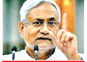
जाति जनगणना पर एक्शन की तैयारी