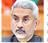
आयोजित किया गया था। और 27 में पहली बार भारत-ईयू शिखर सम्मेलन आयोजित किया गया था। पुर्तगाली राष्ट्रपति पद के तहत 2021 में नेतृत्व शिखर सम्मेलन भी आयोजित किया गया था। उस समय कोविड के कारण इसे वर्चुअल करना पड़ा था। इसलिए हम यूरोपीय संघ के साथ हमारी एफटीए वार्ता के लिए पुर्तगाली समर्थन पर बहुत अधिक भरोसा करते हैं। जयशंकर ने आगे कहा, इसे बात पर भी सहमति थी कि हम एक कांसुलर संवाद तंत्र स्थापित करेंगे और इसकी पहली बैठक के लिए पुर्तगाल आकर हमें खुशी होगी। विदेश मंत्री इस समय पुर्तगाल के दौरे पर हैं।

एजेंसी। नई दिल्ली दिल्ली में चल रही मुक्त व्यापार समझौता (एफटीए) वार्ता में भारत को पुर्तगाल का समर्थन मिलने की उम्मीद है। यह भरोसा दिलाते हुए विदेश मंत्री एस जयशंकर ने कहा कि भारत ने हमेशा ही पुर्तगाल को यूरोपीय संघ में अपने प्रमुख साझेदारों में से एक माना है। विदेश मंत्री जयशंकर ने अपने पुर्तगाली समकक्ष जोआओ गोम्स क्राविन्हो के साथ संयुक्त प्रेस वक्तव्य में कहा, मैं यह कहना चाहता हूँ कि हमने हमेशा पुर्तगाल को यूरोपीय संघ में अपने प्रमुख साझेदारों में से एक माना है। पहला भारत-ईयू शिखर सम्मेलन वास्तव में पुर्तगाली अध्यक्षता के तहत 2000 में आयोजित किया गया था। और 27 में पहली बार भारत-ईयू शिखर सम्मेलन आयोजित किया गया था। पुर्तगाली राष्ट्रपति पद के तहत 2021 में नेतृत्व शिखर सम्मेलन भी आयोजित किया गया था। उस समय कोविड के कारण इसे वर्चुअल करना पड़ा था। इसलिए हम यूरोपीय संघ के साथ हमारी एफटीए वार्ता के लिए पुर्तगाली समर्थन पर बहुत अधिक भरोसा करते हैं। जयशंकर ने आगे कहा, इसे बात पर भी सहमति थी कि हम एक कांसुलर संवाद तंत्र स्थापित करेंगे और इसकी पहली बैठक के लिए पुर्तगाल आकर हमें खुशी होगी। विदेश मंत्री इस समय पुर्तगाल के दौरे पर हैं।