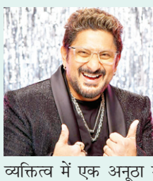
अभिनेता अरशद वारसी 'झलक दिखला जा' में जज के रूप में टेलीविजन पर वापसी करने के लिए तैयार हैं। उन्होंने कहा कि कैसे नृत्य हमेशा उनके सबसे बड़े जुनूनों में से एक रहा है। साथ ही कहा कि उनका लक्ष्य प्रतिभागियों को दिल से नृत्य करने के लिए प्रेरित करना होगा। यह शो जीवन के विभिन्न क्षेत्रों से आपके पसंदीदा सितारों के सार्वजनिक व्यक्तित्व में एक अनूठा मोड़ जोड़ता है। वे प्रतिष्ठित ट्रॉफी के लिए प्रतिस्पर्धा करते हुए जटिल नृत्य दिनचर्या सीखने और प्रदर्शन करने की चुनौती लेते हैं। अरशद का करिश्मा और नृत्य तथा अभिनय के प्रति अद्वितीय दृष्टिकोण उन्हें निर्णायक फैसले में शामिल करने के लिए एकदम उपयुक्त बनाता है। उसी के बारे में बात करते हुए उन्होंने कहा, नृत्य हमेशा से मेरे सबसे बड़े जुनूनों में से एक रहा है और मुझे वर्षों से इस मंच पर शानदार प्रदर्शन देखना पसंद है। मेरे मन में उन प्रतिभागियों के लिए बहुत सम्मान है जो अपने आराम की ज़िंदगी से बाहर निकलकर इसमें हिस्सा लेंगे। उन्होंने कहा कि इस चुनौती का सामना करें, और प्रत्येक प्रदर्शन को बेहतर बनाने में अपना दिल और आत्मा लगा दें।

अभिनेता अरशद वारसी 'झलक दिखला जा' में जज के रूप में टेलीविजन पर वापसी करने के लिए तैयार हैं। उन्होंने कहा कि कैसे नृत्य हमेशा उनके सबसे बड़े जुनून में से एक रहा है। साथ ही कहा कि उनका लक्ष्य प्रतिभागियों को दिल से नृत्य करने के लिए प्रेरित करना होगा। यह शो जीवन के विभिन्न क्षेत्रों से आपके पसंदीदा सितारों के सार्वजनिक व्यक्तित्व में एक अनूठा मोड़ जोड़ता है। वे प्रतिष्ठित ट्रॉफी के लिए प्रतिस्पर्धा करते हुए जटिल नृत्य दिनचर्या सीखने और प्रदर्शन करने की चुनौती लेते हैं। अरशद का करिश्मा और नृत्य तथा अभिनय के प्रति अद्वितीय दृष्टिकोण उन्हें निर्णायक फैसले में शामिल करने के लिए एकदम उपयुक्त बनाता है। उसी के बारे में बात करते हुए उन्होंने कहा, नृत्य हमेशा से मेरे सबसे बड़े जुनूनों में से एक रहा है और मुझे वर्षों से इस मंच पर शानदार प्रदर्शन देखना पसंद है। मेरे मन में उन प्रतिभागियों के लिए बहुत सम्मान है जो अपने आराम की ज़िंदगी से बाहर निकलकर इसमें हिस्सा लेंगे। उन्होंने कहा कि इस चुनौती का सामना करें, और प्रत्येक प्रदर्शन को बेहतर बनाने में अपना दिल और आत्मा लगा दें।