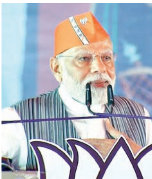
कांग्रेस सरकार की नाकामी देखी है, इन वर्षों में कांग्रेस के नेताओं की कोटियां, उनके बंगले, उनकी कारें, इन्हीं का विकास हुआ है। कांग्रेस के नेताओं के

एजेंसी। कांकेर प्रधानमंत्री नरेन्द्र मोदी ने कहा कि छत्तीसगढ़ में भाजपा के समर्थन में जो आंधी चल रही है, वह कांकेर में भी दिख रही है। भाजपा का संकल्प छत्तीसगढ़ के लोगों को सशक्त कर छत्तीसगढ़ को देश के समृद्ध राज्यों में लाने का है। उन्होंने कहा कि कांग्रेस और विकास में छत्तीस का आंकड़ा है, जहां कांग्रेस रहेगी, वहां विकास हो ही नहीं सकता। प्रधानमंत्री मोदी गुरुवार को जिले के गोविंदपुर में भाजपा की विजय संकल्प रैली को संबोधित कर रहे थे। उन्होंने कहा कि तीस टका कका, आपका काम पक्का वाली सरकार को बाहर करना है। आपने बीते पांच वर्ष में