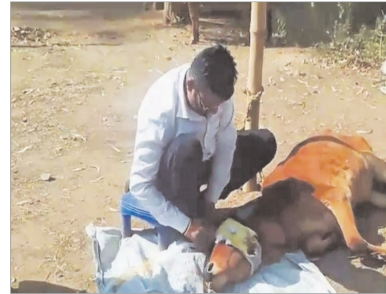
उनका जीना मुश्किल हो गया था। पशुधियों व इसी दौरान एक दिन उन्हें सड़क किनारे लावारिस जीव-जंतुओं में वे अपनी मां को ढूँढने लगे। बड़ड़ा दिया। जिसे वे अपने घर ले आए। उसके बाद मां की बरसी के दिन एक बछिया कहीं से भटककर खुद ब खुद घर पर आ गई। जिसके बाद उन्होंने गाय की सेवा करना शुरू कर दिया। कोरोना काल में उनके सिर से पिता का साया भी उठ गया। उसके बाद तो उनका मन पढाई से भी उचट गया तथा वे पूरी तरह से गौ सेवा को ही अपने जीवन का उद्देश्य बना लिये हैं। धीरे-धीरे गावों की संख्या भी बढ़ने लगी। वर्तमान में उनके गोशाला में 42 गाय हैं। कार्य में उन्हें अपनी बहनो से भी भरपूर सहयोग मिल रहा है। गावों की सेवा के लिए खमडीहा गांव में एग्रीमेंट पर जमीन लेकर गोशाला बनाई है। गोसेवा के कारण ही ला ग्रेजुएट होने के बाद भी उन्होंने बार एसोसिएशन में पंजीकरण भी नहीं कराया। सड़क पर मिले बीमार अथवा दुर्घटनाग्रस्त गावों का वे खुद ही उपचार करते हैं। उन्होंने कहा कि हिंदू धर्म में गाय को माता का दर्जा दिया गया है। जिनमें 33 कोटि के देवी-देवता विराजमान रहते हैं। गौ वंश की सेवा कर उन्हें माता-पिता की सेवा करने जैसा प्रेम मिलता है।