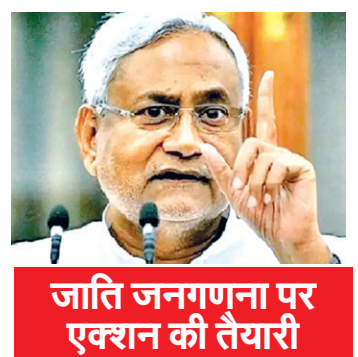
जाति जनगणना पर एक्सन की तैयारी

सत्तावालों ने कानूनी दांव पेंच की तैयारी शुरू कर दी है। ताकि यदि नीतीश ने विधान सभा में वे विधेयक लाकर पास करा दिया तो इसे कानूनी पेंच में फंसा कर, राज्यपाल के कार्यालय में अटकवाकर, किसी भी हालत में 2024 के लोकसभा चुनाव होने तक टाला जा सके। इसके लिए झारखंड का उदाहरण दिया जा सकता है। क्योंकि झारखंड सरकार ने आरक्षण सीमा बढ़ाने की पुर्जोर कोशिश की, लेकिन उसका प्रस्ताव खारिज हो चुका है। मालूम हो कि सर्वोच्च न्यायालय ने 1992 में ऐसे ही मामले में स्पष्ट किया था कि आरक्षण की सीमा 50 प्रतिशत से अधिक करना ठीक नहीं है। लेकिन कई राज्यों ने जातीय जनगणना के आधार पर आरक्षण का प्रतिशत बढ़ाकर 70 करने की मांग शुरू कर दी है। इंडिया गठबंधन दलों पर रेवडी बांटेन का बहुत जोर शोर से आरोप लगाने वाली केन्द्रीय सत्ताधारी भाजपा ने खुद भी कुछ माह पहले तक कर्नाटक में सत्ता में रहने के दौरान विधान सभा चुनाव के समय एएससी/एएसटी के लिए आरक्षण 50 प्रतिशत कोटा सीमा से ऊपर बढ़ा दिया था।