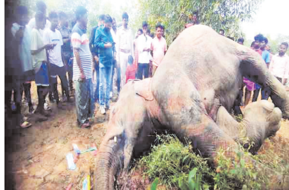
नवीन मेल संवाददाता

जमशेदपुर। 30 अक्टूबर को बिजली प्रवाहित तार से सट जाने से मादा हाथी घायल हो गई थी। उसकी मंगलवार की रात में मौत हो गई। बुधवार की सुबह मृत मादा हाथी का शव हवाई पट्टी बड़ामारा पंचायत के ज्वालाभांगा गांव के पास खेत में पाया गया। सूचना पाकर वन विभाग की टीम घटना स्थल पर पहुंची है। जानकारी हो कि विगत मंगलवार को उक्त मादा