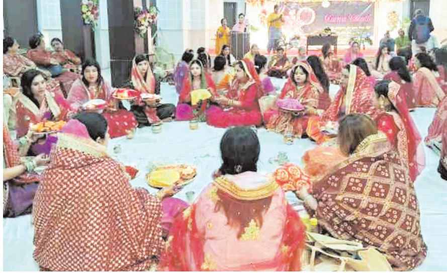
नवीन मेल संवाददाता जमशेदपुर। जिला मुख्यालय समेत ग्रामीण क्षेत्रों अखंड सुहाग का प्रतीक करवा चौथ का पर्व बुधवार

को श्रद्धा, उत्साह और परंपरा के साथ मनाया गया। इस दौरान सुहागिनों ने पति की लंबी उम्र व सुहाग की रक्षा के लिए निर्जला व्रत