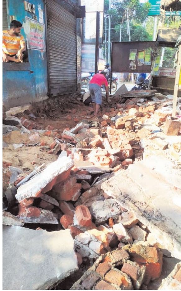
हादसे हो रहे हैं इसके बावजूद सिमडेगा बस स्टैंड टैक्सी स्टैंड का पूरा एरिया प्रशासन द्वारा