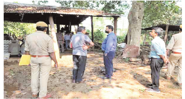
नवीन मेल संवाददाता