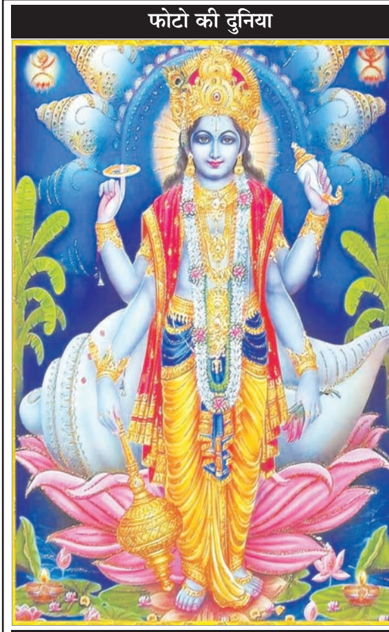
फोटो की दुनिया