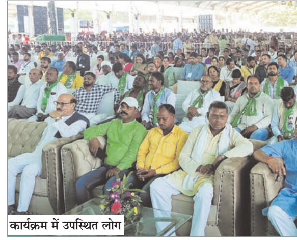
कार्यक्रम में उपस्थित लोग