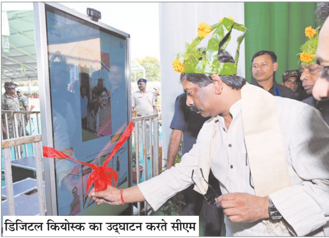
डिजिटल कियोस्क का उद्घाटन करते सीएम