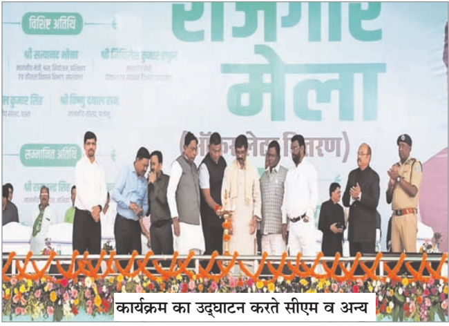
कार्यक्रम का उद्घाटन करते सीएम व अन्य