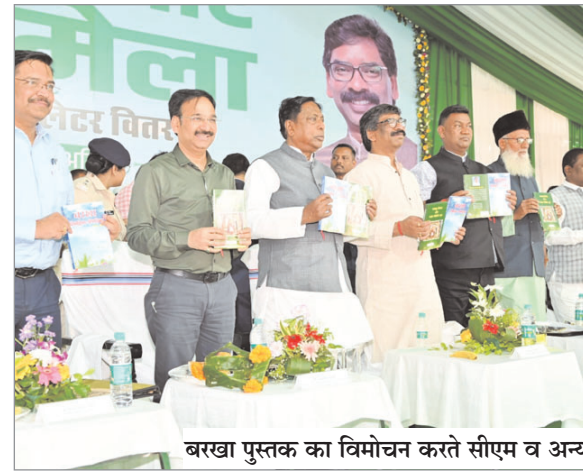
बरखा पुस्तक का विमोचन करते सीएम व अन्य