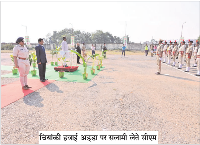
चियांकी हवाई अड्डा पर सलामी लेते सीएम