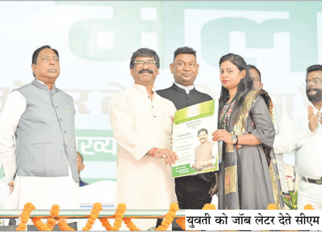
युवती को जांब लेटर देते सीएम