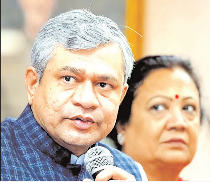
कॉंग्रेस नेता राहुल गांधी, शशि थरूर, शिवसेना (यूबीटी) की सांसद प्रियंका चतुर्वेदी, तृणमूल कॉंग्रेस की महुआ मोइत्रा और आम आदमी पार्टी (आप) के

एपल आईफोन हैकिंग के दावों को केंद्र सरकार ने मंगलवार को सिर से खारिज कर दिया। केंद्रीय आईटी मंत्री अश्विनी वैष्णव ने साथ ही कहा कि आरोपों की जांच के लिए आदेश दिए गए हैं। अश्विनी वैष्णव ने कहा कि कुछ साधियों ने एपल अलर्ट के बारे में संदेश दिए हैं, ऐसे में हम मामले की तह तक जाएंगे। उन्होंने विपक्ष के आरोपों पर कहा, "कुछ हमारे अलोचक हैं जो झूठे आरोप हमेशा लगाते रहते हैं। ये देश की प्रगति नहीं चाहते। एपल ने 150 देशों में एडवाइजरी जारी की है। एपल ने अनुमान के आधार पर मैसेज भेजा है। एपल ने अपना स्पष्टीकरण जारी कर दिया है। वैष्णव ने कहा कि इनकी (विपक्षी दलों) आदत है कि जब भी कोई अहम मुद्दा नहीं होता तो कहते हैं कि निगरानी हुई है। इन्होंने ये आरोप कुछ साल पहले भी लगाने की कोशिश की थी। इसकी जांच सुप्रीम कोर्ट की निगरानी में हुई, लेकिन कुछ नहीं निकला। प्रियंका गांधी ने भी दावा किया था कि उनको दो बच्चों का फोन हैक हुआ था, लेकिन कुछ नहीं हुआ।"