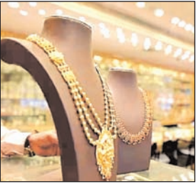
कारोबार कर रहा है। करवा चौथ के बाद लोग धनतेरस, दिवाली और भाई दूज पर भी जमकर सोने की खरीदारी करते हैं तो सोने के दाम कम होने का फायदा ले सकते हैं। शुरुआती दौर में सोना जहां 61,117 रुपये प्रति 10 ग्राम के स्तर पर खुला है। इसके बाद इसकी कीमत में कुछ सुधार देखा गया

मंगलवार अक्टूबर का आखिरी दिन था और आज से नवंबर की शुरुआत हो गई। नवंबर में भारत में त्योहारी सीजन के तहत कई बड़े त्योहार आने वाले हैं। 1 नवंबर को सुहागिनों का प्रमुख त्योहार करवा चौथ मनाया जाएगा। ऐसे में अगर आप करवा चौथ के मौके पर अपनी पत्नी के लिए गोल्ड या सिल्वर ज्वेलरी खरीदने के बारे में सोच रहे हैं तो आपके लिए खुशखबरी है। करवा चौथ से ठीक एक दिन पहले वायदा बाजार में सोना और चांदी दोनों सस्ते हो गए हैं। मंगलवार को मल्टी कमोडिटी एक्सचेंज पर सोना गिरावट के साथ