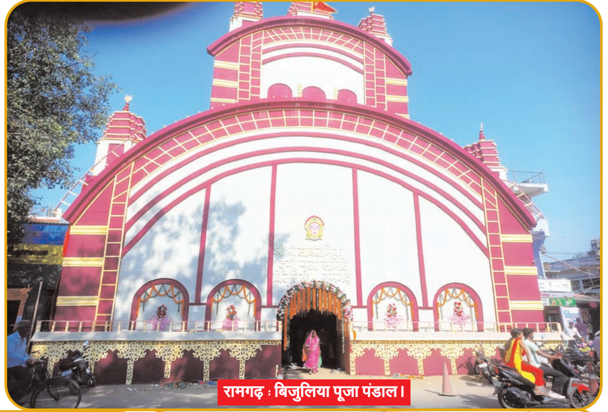
रामगढ़ : विजुलिया पूजा पंडाल ।