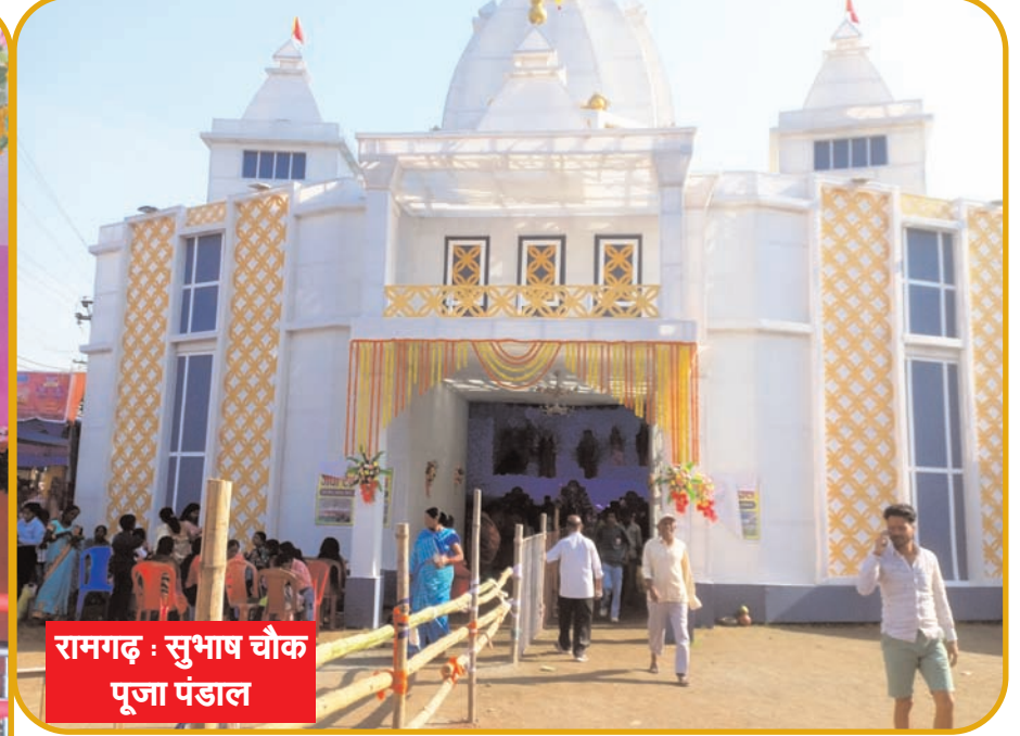
रामगढ़ : सुभाष चौक पूजा पंडाल

है। सार्वजनिक दुर्गा पूजा समिति मड़ई मेला टांड सुभाष चौक द्वारा स्थापित स्वचालित प्रतिमा जिसमें माता दुर्गा द्वारा महिषासुर के वध का दृश्य दिखाया गया है, लोगों के आकर्षण का केंद्र बनी हुई है। वहां रात्रि में बड़ी संख्या में श्रद्धालु पहुंच रहे हैं।