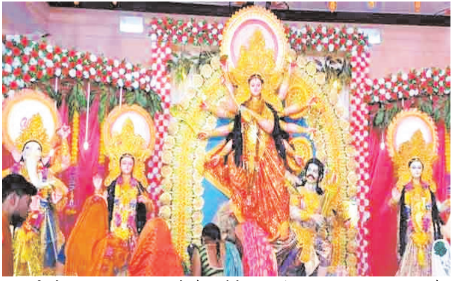
नवीन मेल संवाददाता कोडरमा। जिले भर में शारदीय नवरात्रि को लेकर लोगों में काफी उत्साह है. महा अष्टमी के मौके पर

पंडालों और मंदिरों में पूजा-अर्चना के लिए श्रद्धालुओं की भीड़ उमड़ी. शुभरी तिलैया के कला मंदिर, महाराणा प्रताप चौक,