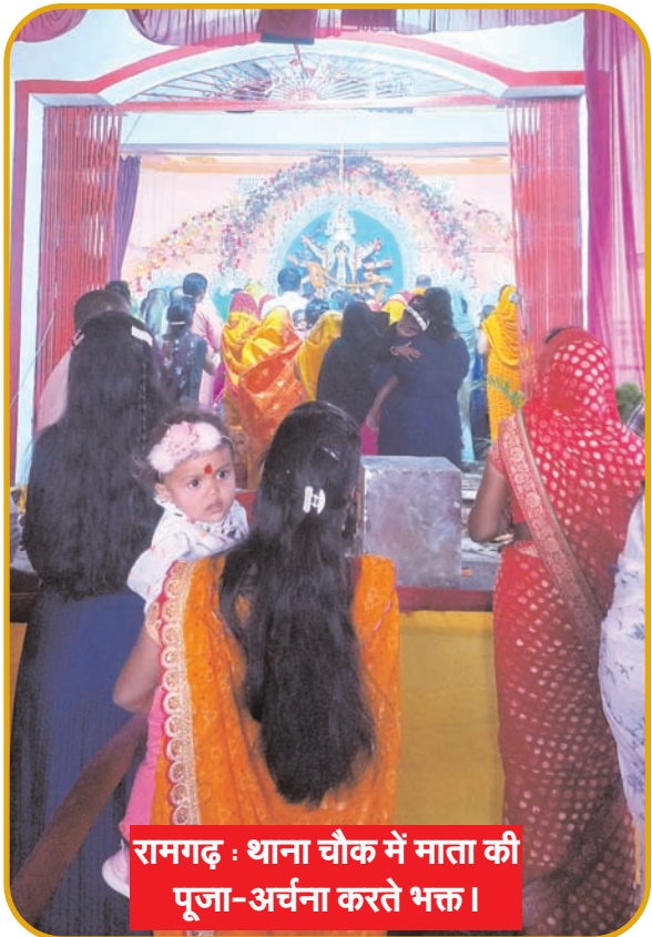
रामगढ़ : थाना चौक में माता की पूजा-अर्चना करते भक्त ।

नवीन मेल संवाददाता रामगढ़। शहर सहित जिलाभर में दुर्गा पूजा को लेकर लोगों में उत्साह का माहौल है। दुर्गा पूजा को लेकर शहर सहित जिलाभर में विभिन्न पूजा समितियों की ओर से भव्य और आकर्षक पंडालों का निर्माण करवाया गया है। पंडालों में माता दुर्गा की भव्य प्रतिमाएं स्थापित की गई हैं। जहां पहुंचकर श्रद्धालु माता की पूजा अर्चना कर कुशलता की कामना कर रहे हैं। रविवार को शारदीय नवरात्र के 8वें दिन माता के आठवें स्वरूप माता महागौरी की पूजा अर्चना के लिए पूजा पंडालों में श्रद्धालुओं की भारी भीड़ उमड़ी। मौके पर श्रद्धालुओं ने माता महागौरी की पूजा अर्चना कर उनसे कुशलता और सुख समृद्धि की कामना की। दुर्गा पूजा को लेकर विभिन्न पूजा समितियों ने भव्य और आकर्षक पूजा पंडालों का निर्माण करवाया है। पंडालों में स्थापित माता की प्रतिमाओं का दर्शन कर आशीर्वाद लेने के लिए रात्रि में श्रद्धालुओं की भारी भीड़ उमड़ रही