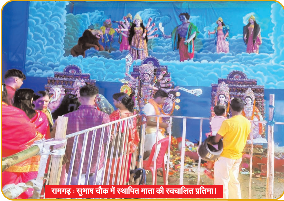
रामगढ़ : सुभाष चौक में स्थापित माता की स्वचालित प्रतिमा ।