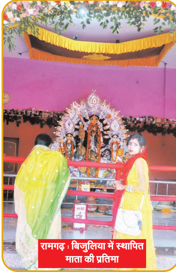
रामगढ़ : विजुलिया में स्थापित माता की प्रतिमा

नवीन मेल संवाददाता रामगढ़। शहर सहित जिलाभर में दुर्गा पूजा को लेकर लोगों में उत्साह का माहौल है। दुर्गा पूजा को लेकर शहर सहित जिलाभर में विभिन्न पूजा समितियों की ओर से भव्य और आकर्षक पंडालों का निर्माण करवाया गया है। पंडालों में माता दुर्गा की भव्य प्रतिमाएं स्थापित की गई हैं। जहां पहुंचकर श्रद्धालु माता की पूजा अर्चना कर कुशलता की कामना कर रहे हैं। रविवार को शारदीय नवरात्र के 8वें दिन माता के आठवें स्वरूप माता महागौरी की पूजा अर्चना के लिए पूजा पंडालों में श्रद्धालुओं की भारी भीड़ उमड़ी। मौके पर श्रद्धालुओं ने माता महागौरी की पूजा अर्चना कर उनसे कुशलता और सुख समृद्धि की कामना की। दुर्गा पूजा को लेकर विभिन्न पूजा समितियों ने भव्य और आकर्षक पूजा पंडालों का निर्माण करवाया है। पंडालों में स्थापित माता की प्रतिमाओं का दर्शन कर आशीर्वाद लेने के लिए रात्रि में श्रद्धालुओं की भारी भीड़ उमड़ रही