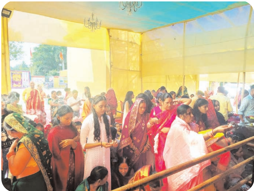
जिले के सभी पूजा पंडालों में आकर्षक साज-सज्जा की गई है। शहर के रामजानकी मंदिर, नीचे बाजार, कुंजनगर, प्रिस चौक, नगर भवन, गुलजार गली एवं शामटोली समेत गरजा एवं अन्य प्रखंडों में

सिमडेगा। नवरात्रि की महाअष्टमी तिथि को पंडालों में श्रद्धालु उमड़ पड़े। भक्तों ने माता के आठवें स्वरूप महागौरी देवी की पूजा की। पंडालों में सुबह से ही भक्त पहुंचने लगे थे। दोपहर तक पंडालों में पूजा-अर्चना का क्रम चलते रहा। थाल सजाकर श्रद्धालुओं ने माता की आरती उतारी। पंडालों में आचार्यों ने विधि पूर्वक व मंत्रोच्चार करते हुए मां दुर्गा की पूजा-अर्चना कराई। माता को कुमकुम, दुर्वा, अक्षत, अड़हल का फूल के साथ-साथ धूप-दीप अर्पित किया। आरती कर महाप्रसाद अर्पित किया गया। इधर दशहरा के पर्व को लेकर लोगों में श्रद्धा एवं आस्था उमड़ रहा है। संख्या में बड़ी संख्या में लोग माता के दर्शन के लिए उमड़ रहे हैं। इस भीड़ में बारी-बारी से कलाकृत होकर मां भगवती के ममतामयी स्वरूप का दर्शन कर मंगल कामना की। माता से जगत कल्याण की कामना की गई। इधर सुरक्षा को लेकर भी पंडालों व आस-पास के क्षेत्र में कड़े इंतजाम