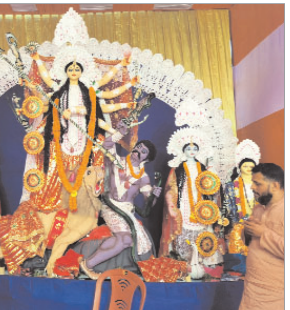
लोहरदगा में एक पूजा पंडाल में स्थापित की गई मां दुर्गे की भव्य मूर्ति।