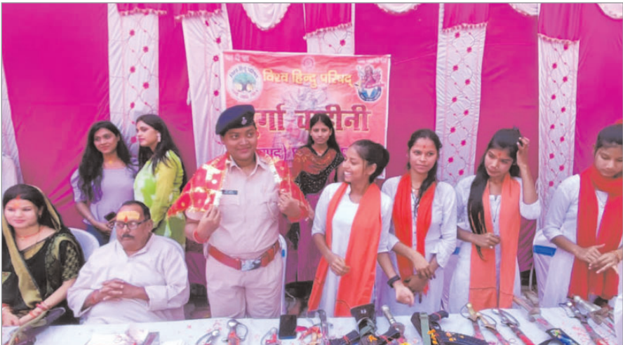
मनाने की अपील की। महिला थाना प्रभारी ने शारदीय नवरात्र की शुभकामनाएं देते हुए सभी से