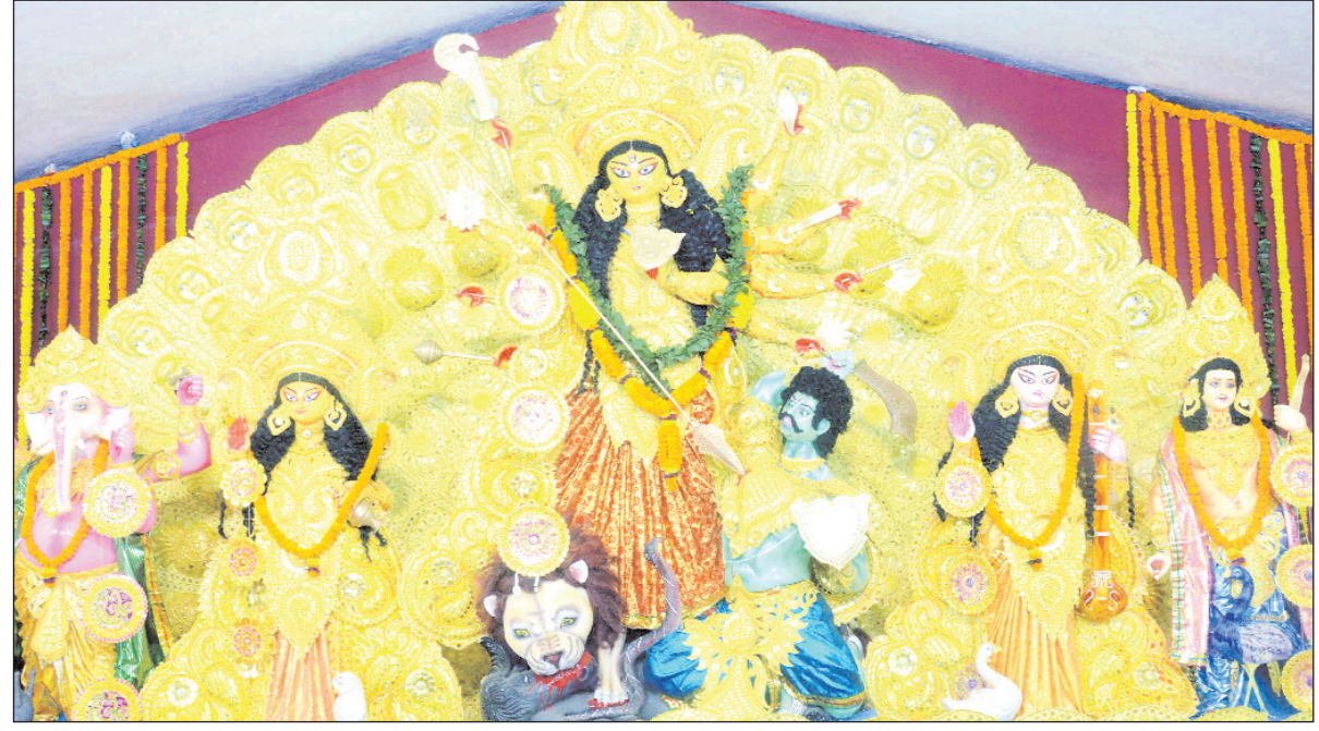
हरीमति मंदिर लालपुर पंडाल में मां की दर्शन के लिए भक्तों की भीड़