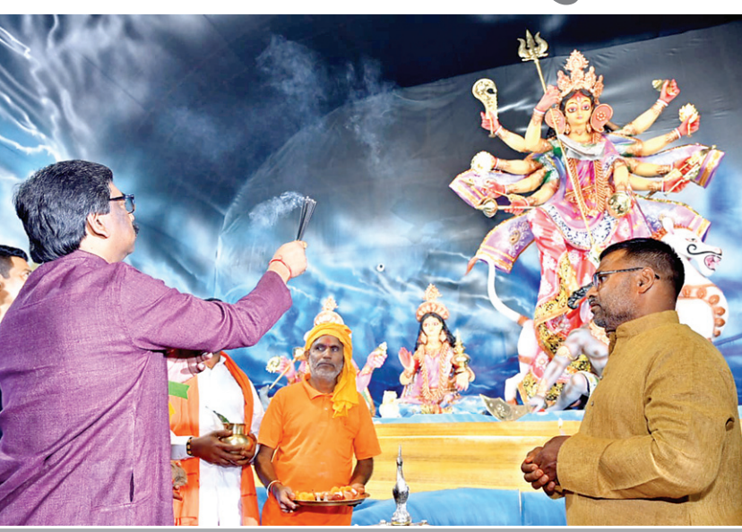
रांची मुख्यमंत्री हेमंत सोरेन ने शारदीय नवरात्र के षष्ठी के अवसर पर शुक्रवार को बांधगाड़ी दुर्गा पूजा समिति और हरिमती दुर्गा पूजा पंडाल, लालपुर का किया अनावरण। देवी दुर्गा के दरबार में शीश नवाकर राज्य की उन्नति, सुख-समृद्धि और शांति की कामना की। उन्होंने कहा कि मां का आशीर्वाद सभी पर बना रहे, सभी अपने क्षेत्र में उन्नति करें करें, यही मां से कामना है। उन्होंने राज्यवासियों को दुर्गा पूजा की बधाई और शुभकामनाएं दी।