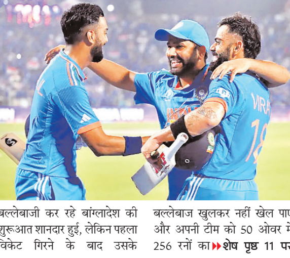
बल्लेबाजी कर रहे बांग्लादेश की शुरुआत शानदार हुई, लेकिन पहला विकेट गिरने के बाद उसके बल्लेबाज खुलकर नहीं खेल पाए और अपनी टीम को 50 ओवर में 256 रनों का शेष पृष्ठ 11 पर

एजेंसी। नई दिल्ली भारत ने गुरुवार को पुणे में बांग्लादेश को 7 विकेट से हराकर इस विश्व कप में अपनी जीत का चौका लगा दिया। 257 रनों के लक्ष्य को भारत ने विराट कोहली के शानदार नाबाद शतक की मदद से बड़ी आसानी से हासिल कर लिया। लक्ष्य पीछा करने उतरी भारतीय टीम को कप्तान रोहित शर्मा ने एक बार फिर शानदार शुरुआत दिलाई, हालांकि, वो दो रन से अपना अर्धशतक लगाने से चूक गए। रोहित के बाद शुभमन विल ने 53 रन बनाए। किंग कोहली 103 रनों के साथ नाबाद रहे इससे पहले टॉस जीतकर पहले