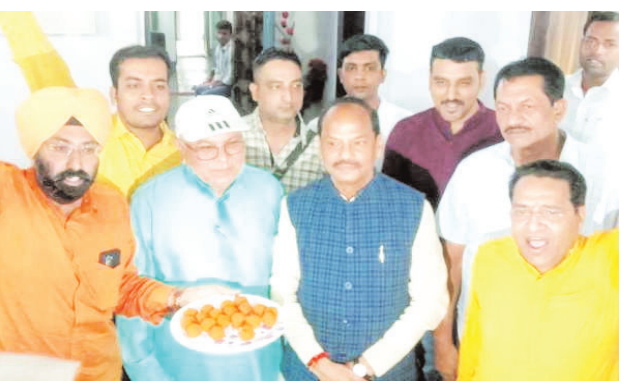
कही। इस दौरान कार्यकर्ताओं की भीड़ उनके आवास पर उमड़ पड़ी, सभी ने उन्हें मिठाई खिलाकर राज्यपाल बनाये जाने पर बधाई दी।