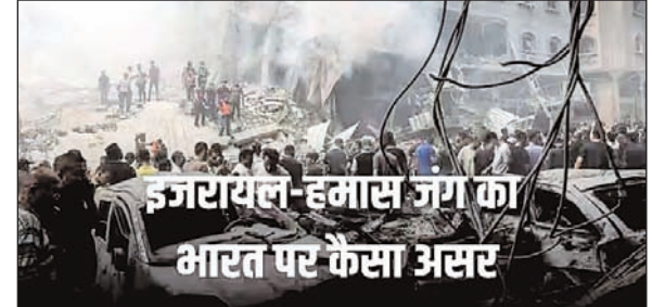
इजरायल-हमास युद्ध का भारत पर कैसा असर

एजेंसी। नई दिल्ली इजरायल-हमास युद्ध के बीच वैश्विक तौर पर इसके असर का आकलन होने लगा है। कई ऐसे देश हैं जो इजरायल-हमास युद्ध से सीधे तौर पर प्रभावित हो रहे हैं और रक्षा के मोर्चे सहित अर्थव्यवस्था पर इसका नकारात्मक असर झेल रहे हैं। भारत भी इससे अछूता नहीं रहने वाला है क्योंकि भारत से इजरायल के बीच अच्छा-खासा व्यापार है। भारत से इजरायल को मुख्य रूप से मोती और कीमती पत्थर, ऑटोमोटिव डीजल, कैमिकल और मिनरल प्रोडक्ट्स, मशीनरी और इलेक्ट्रिकल इक्विपमेंट, प्लास्टिक, टैक्सटाइल और वस्त्र प्रोडक्ट्स, वेस मेटल्लस और ट्रांसपोर्ट इक्विपमेंट से लेकर कृषि उत्पादों का निर्यात होता है। भारत से इजरायल को वित्त वर्ष 2023-23 में कुल 2.04 बिलियन डॉलर का जेम्स एंड ज्वेलरी ट्रेड हुआ है जबकि इससे पिछले वर्ष यानी वित्त वर्ष 2021-22 में 2.8 बिलियन डॉलर का ट्रेड हुआ था। भारत-इजरायल के बीच वित्त वर्ष 2022-