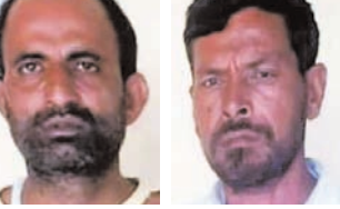
दोनों आरोपी गिरफ्तार।

दुकान के सामने से खड़े वाहन हटाने को लेकर हुई थी झड़प