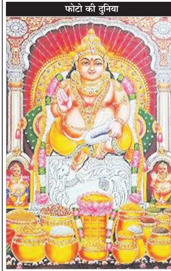
फोटो की दुनिया

के बराबर कुछ अधिकार मिलते हैं। सबसे पहला सवाल तो यही उठता है कि क्या भ्रूण एक कानूनी व्यक्ति है या नहीं? इस सवाल का जवाब इस आधार पर दिया जा सकता है कि भ्रूण में जीवन है या नहीं? भारतीय कानूनों में जीवन और मृत्यु से जुड़े कई प्रावधान हैं। भारत के आपराधिक कानून के अनुसार, गर्भावस्था की अवधि के लिए बच्चा मां के पास होता है और भ्रूण के रूप में बच्चे का जीवन होता है। अगर कोर्ट और कानून भ्रूण के रूप में बच्चे का जीवन स्वीकार करते हैं तो उसके कुछ संवैधानिक अधिकार भी होते हैं।