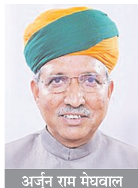
अर्जुन राम मेघवाल

स्वतंत्रता प्राप्ति के 75 वर्ष पूरे होने पर मनाये जा रहे अमृत महोत्सव के युग को चिह्नित करते हुए भारत ने महिलाओं के लिए मताधिकार सुनिश्चित करने से आगे बढ़ते हुए उनके लिए संसद और विधान सभाओं में प्रतिनिधित्व का अधिकार भी सुनिश्चित किया है। पूज्य बाबा साहेब डॉक्टर भीमराव अंबेडकर ने संविधान सभा में 25 नवंबर 1949 को दिये गये अपने ऐतिहासिक भाषण में बोलते हुए विशेष रूप से यह पूछा था कि कब तक हम विरोधाभासों का यह जीवन जीते रहेंगे। इस अवसर पर उन्होंने देश को सामाजिक तथा आर्थिक असमानताओं के प्रति