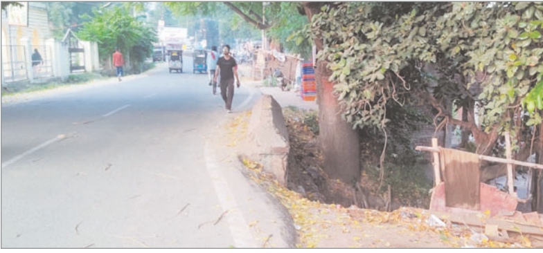
सेपटी दीवार नहीं बनाया गया तो आने वाला है। वहीं कुछ वर्ष पहले ही एक युवक की समय में यहां पर कोई बड़ी घटना घट सकती है। वहीं कुछ वर्ष पहले ही एक युवक की शराब के नशे में पुल में गिरकर मौत हो गई थी।

नवीन मेल संवाददाता मेदिनीनगर। शहर थाना क्षेत्र के साहित्य समाज चौक स्थित बड़ा तालाब के पास बना पुल घटना को आमंत्रित कर रहा है। बताते चलें कि इस रास्ते से प्रतिदिन हजारों की संख्या में वाहनों का आवागमन होता है। यदि इस जगह पर दुर्घटना हो जाती है तो लोगों का बचना मुश्किल है। स्थानीय लोगों ने बताया कि पुल के पास सेपटी दीवार नहीं रहने की वजह से यहां कई बार दुर्घटना हो चुकी है। कुछ महीने पहले ही यहां पर अटॉरिक्शा अनियंत्रित होकर पुल में जा गिरा था। जिसमें चालक अपनी चतुराई से बच गया था। स्थानीय लोगों का कहना है कि यदि समय रहते इस जगह पर