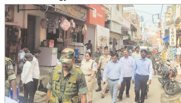
शहर के महावीर भी जीवन पहुंचकर पूजा स्थल का जायजा लिया। वहीं अधिकारियों ने पूजा समिति के लोगों से कहा कि हो संके तो सीसीटीवी लगावें। ताकि असामाजिक तत्वों के लोग गलत कार्य नहीं कर सकें। साथ ही उन्होंने ने पुलिस पदाधिकारियों को संवेदनशील स्थानों को चिन्हित कर पुलिस बल प्रतिनियुक्त करने का निर्देश दिया। साथ ही डीसी एसपी ने सभी क्षेत्र के थाना प्रभारियों को

नवीन मेल संवाददाता हुसैनाबाद। दुर्गा पूजा के दौरान पुष्पा सुरक्षा व्यवस्था व विधि व्यवस्था की स्थिति को सामान्य रखने के लिए पलामू डीसी शशि रंजन, पुलिस अधीक्षक रोमा रमेशन, डीडीसी रवि आनंद ने मंगलवार को पूजा पंडालों का निरीक्षण किया। अधिकारियों ने सबसे पहले अनुमंडल के कपूर्ती मैदान में निर्माणधीन पूजा पंडाल का निरीक्षण किया। इसके बाद जपला स्टेशन परिसर के पूजा पंडाल का निरीक्षण किया और समिति के सदस्यों से पूजा कार्यक्रम से संबंधित तैयारियों के बारे में जानकारी ली। इसके बाद मुख्य बाजार होते हुए