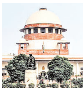
एक्ट में बदलाव करने का अधिकार केवल संसद के पास है। कोर्ट को संसद के अधिकार क्षेत्र में दखल देने में सावधानी बरतनी चाहिए। संविधान बेंच के सदस्य जस्टिस संजय किशन कौल ने चीफ जस्टिस के फैसले पर अपनी सहमति जताई। जस्टिस एस रवींद्र भट्ट ने चीफ जस्टिस के फैसले से असहमति जताते हुए कहा कि समलैंगिक जोड़े को बच्चा गोद लेने का अधिकार नहीं दिया जा सकता। जस्टिस हिमा कोहली ने जस्टिस एस रवींद्र भट्ट के फैसले से सहमति जताई। सुप्रीम कोर्ट ने इस मामले पर दस दिनों तक सुनवाई करने के बाद 11 मई को फैसला सुरक्षित रख लिया था। सुनवाई के दौरान राष्ट्रीय बाल अधिकार संरक्षण आयोग ने कहा था कि जेंडर की अवधारणा परिवर्तनीय हो सकती है, लेकिन मां और मातृत्व नहीं। कोर्ट ने कहा था कि एक बच्चे का कल्याण सर्वोपरि होता है। देश का कानून विभिन्न कारणों से गोद लेने की अनुमति प्रदान करता है। यहां तक कि एक अकेला व्यक्ति भी बच्चा गोद ले सकता है। ऐसे पुरुष या महिलाएँ, एकल यौन संबंध में हो सकते हैं। कोर्ट ने कहा कि आप संतानोत्पत्ति में सक्षम हैं तब भी आप बच्चा गोद ले सकते हैं। जैविक संतानोत्पत्ति की कोई अनिवार्यता नहीं है।

एजेंसी। नई दिल्ली सुप्रीम कोर्ट ने समलैंगिक विवाह को मान्यता देने से इनकार कर दिया है। समलैंगिक विवाह पर चार जजों सीजेआई, जस्टिस संजय किशन कौल, जस्टिस एस रवींद्र भट्ट और जस्टिस पीएस नरसिम्हा, जस्टिस हिमा कोहली की बेंच ने बंटा हुआ फैसला सुनाया। सुप्रीम कोर्ट ने कहा कि समलैंगिक साथ रह सकते हैं, लेकिन विवाह को मान्यता नहीं दी जा सकती। सुप्रीम कोर्ट ने कहा है कि स्पेशल मैरिज एक्ट में बदलाव करने का अधिकार केवल संसद के पास है, इसलिए केंद्र सरकार को एलजीबीटीक्यू समुदाय के साथ भेदभाव रोकने के लिए जरूरी कदम उठाने का निर्देश दिया। इस मामले पर फैसला सुनाते हुए चीफ जस्टिस डीवाई चंद्रचूड़ ने कहा कि समलैंगिक जोड़े को भी सामान्य लोगों की तरह उनका उनका अधिकार मिलना चाहिए। चीफ जस्टिस ने कहा कि यह तर्क सही नहीं है कि समलैंगिक कपल बेहतर पैरेंट नहीं हो सकते। इसी कोर्ट स्टडी नहीं है कि सामान्य कपल बेहतर पैरेंट होते हैं। चीफ जस्टिस ने कहा कि समलैंगिक कपल को विवाह करने का अधिकार है। समलैंगिक कपल को भी बच्चा गोद लेने का अधिकार है। समलैंगिकता सिर्फ शहरों तक सीमित नहीं है, बल्कि गांव में कृषि कार्य में काम करने वाली एक महिला भी समलैंगिक हो सकती है। चीफ जस्टिस ने कहा कि ये कहना कि विवाह की संस्था स्थिर और अपरिवर्तनीय है, सही नहीं है। विवाह की व्यवस्था में कानून के द्वारा बदलाव किया गया है। चीफ जस्टिस ने कहा कि स्पेशल मैरिज