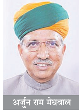
अर्जुन राम मेघवाल

स्वतंत्रता प्राप्ति के 75 वर्ष पूरे होने पर मनाये जा रहे अमृत महोत्सव के युग को चिह्नित करते हुए भारत ने महिलाओं के लिए मताधिकार सुनिश्चित करने से आगे बढ़ते हुए उनके लिए संसद और विधान सभाओं में प्रतिनिधित्व का अधिकार भी सुनिश्चित किया है। पूज्य बाबा साहेब डॉक्टर भीमराव अंबेडकर ने संविधान सभा में 25 नवंबर 1949 को दिये गये अपने ऐतिहासिक भाषण में बोलते हुए विशेष रूप से यह पूछा था कि कब तक हम विरोधाभासों का यह जीवन जीते रहेंगे। इस अवसर पर उन्होंने देश को सामाजिक तथा आर्थिक असमानताओं के प्रति