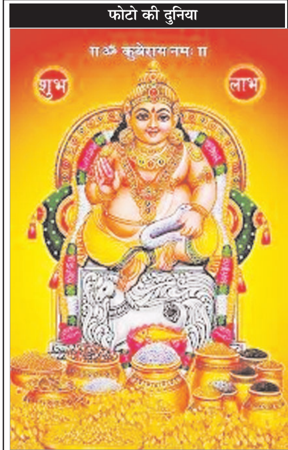
फोटो की दुनिया