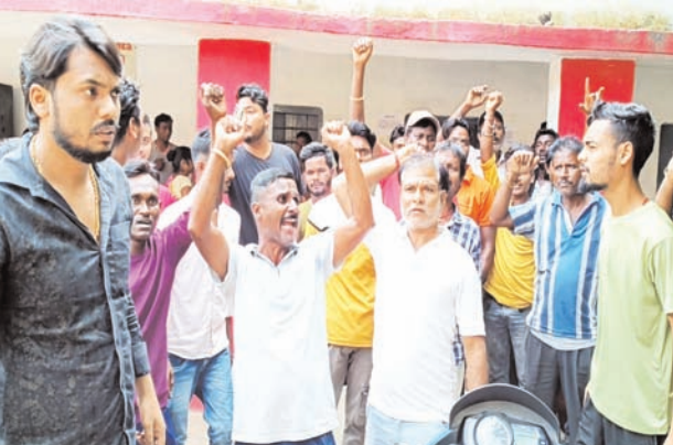
की भी बात करने लगे. वे लोग अपने कर्मों को मांग कर रहे हैं. खबर पाकर धनबाद आरपीएफ पोस्ट के अधिकारी व जवानों के साथ-साथ रेलवे के अधिकारी भी पहुंचे और कर्मियों से बातचीत कर उन्हें समझाया कि उन्हें किसी प्रकार की कोई दिक्कत नहीं होगी. उन्हें इंसाफ मिलेगा. वहीं जनता श्रमिक संघ के

नवीन मेल संवाददाता धनबाद। स्थानीय को हटाने और बाहरी कर्मियों को काम देने के साथ-साथ वैतन और पीएफ कटौती के खिलाफ मंगलवार को धनबाद स्टेशन के रेलवे यार्ड कोचिंग में आउटसोर्स सफाईकर्मियों ने हंगामा करते हुए घंटों काम ठप कर दिया. जिससे सुबह से शाम तक काम प्रभावित रहा. आरपीएफ व रेलवे के अधिकारियों के समझाने के बाद सफाईकर्मियों का काम ठप हो गया. जानकारी के अनुसार, सफाईकर्मियों का कहना था कि वे लोग पिछले दस वर्षों से उर्मिल सविसेज कंपनी की अधीन काम कर रहे थे. इधर 4 दिनों से नई कंपनी अरुण इंटरप्राइजेज को ठेका मिला है. नई कंपनी के ठेकेदार वैतन व पीएफ कटौती की बात करने लगे. जिससे वे लोग विरोध में आकर काम ठप कर दिया. स्थानीय कर्मों को हटाकर बाहरी कर्मों को काम दिलाने