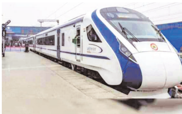
बजे खुलेगी और रात 10 बजे टाटानगर पहुंचेगी. फिलहाल इस ट्रेन का क्रियायत तय नहीं किया गया है.

टाटानगर से खुलकर पुरूलिया, बोकोरो स्टील सिटी, गया और पं. दीन दयाल उपाध्याय जंक्शन पर रुकेगी. इसका मेटेंस टाटानगर स्टेशन में ही किया जाएगा. इसमें कुल 8 कोच होंगे. वहीं यह ट्रेन सप्ताह में 7 दिन चलेगी.