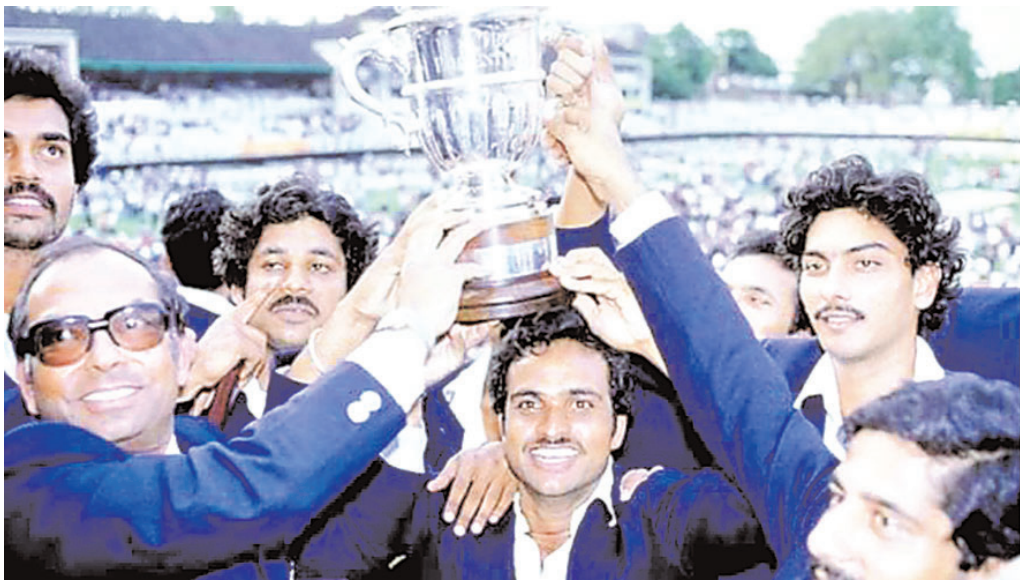
गावस्कर की वो सबसे खराब पारी

भारतीय क्रिकेट का सबसे निराशाजनक प्रदर्शन, वेस्टइंडीज में खेले गए 2007 के वर्ल्ड कप में देखने को मिला था, जब राहुल द्रविड़ की कप्तानी में टीम बांग्लादेश और श्रीलंका के हाथों हार के बाद गुप्त मुकाबलों से ही बाहर हो गई थी। पोर्ट ऑफ स्पेन में खेले गए लो स्कोरिंग मुकाबले में बांग्लादेश ने भारत को पांच विकेट से हराकर सबसे बड़ा उलटफेर कर दिखाया। इस मैच के बाद क्रिकेट विश्वेषकों ने भारतीय टीम के प्रदर्शन को शर्मनाक बताया। विश्वेषकों के मुताबिक, औसत गेंदबाजी और खराब फील्डिंग के चलते टीम इंडिया को शर्मनाक हार का सामना करना पड़ा था। इस हार से गुस्साए भारतीय खेल प्रेमियों ने तत्कालीन विकेटकीपर बल्लेबाज एमएस धोनी के निमाणांधीन मकान परिसर में तोड़फोड़ की थी। कई शहरों में टीम के खिलाफ प्रदर्शन हुए और कोलकाता में खिलाड़ियों का पुतला दहन किया गया।