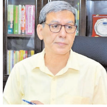
एसएसपी और एसपी के शेष पृष्ठ 11 पर