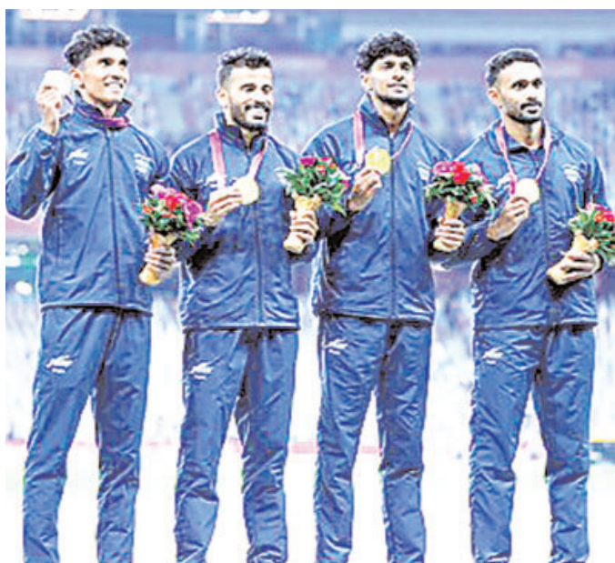
तीरंदाजी, बैडमिंटन, शतरंज, हॉकी, क्रिकेट और कुश्ती में पदक के अवसरों के साथ प्रतिस्पर्धा के तीन और दिनों के साथ अधिकांश प्रशंसकों के मन में सबसे बड़ा सवाल यह है कि क्या भारत पहली बार 100 पदक का आंकड़ा पार कर पाएगा।

एजेंसी। हांगकौंग ओलंपिक और विश्व चैंपियन भालाफेंक खिलाड़ी के नेतृत्व में पुरुषों की 4x400 रिले और कंपाउंड तीरंदाजी में भारत की उभरी ताकत दिखी। देश ने बुधवार को तीन स्वर्ण सहित और 12 पदक जीतकर एशियाई खेलों में अपने पदकों की अब तक की उच्चतम संख्या 81 तक ले गई।