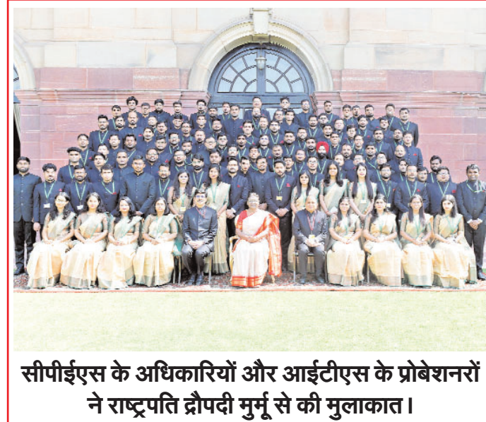
सीपीईएस के अधिकारियों और आईटीएस के प्रोबेशनरों ने राष्ट्रपति द्रौपदी मुर्मू से की मुलाकात।

गया है कि इसका जोखिम लिंग आधारित भी हो सकता है। इस अध्ययन के लिए 2001 से 2022 तक 29 देशों के 150,000 से अधिक वयस्कों के डेटा की जांच की गई। शोध में यह भी पाया गया कि मानसिक स्वास्थ्य विकार सबसे ज्यादा वचपन, किशोरावस्था या युवा लोगों में देखे जा रहे हैं। शोधकर्ताओं ने बताया 15 साल वालों में सबसे कम उम्र में मानसिक स्वास्थ्य समस्याओं की समस्या वाली उम्र देखी गई है। पुरुषों के लिए मानसिक स्वास्थ्य विकारों की औसत उम्र 19 और महिलाओं के लिए 20 है।