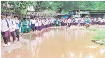
नवीन मेल संवाददाता चाईबासा। लगातार बारिश से मनोहरपुर शहर व आस पास के क्षेत्र को सड़कों पर जलजमाव होने के कारण का चटना मुखिल हो गई है...