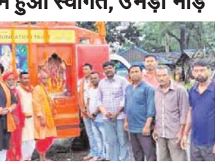
नवीन मेल संवाददाता जमशेदपुर। शौर्य जागरण यात्रा रथ मंगलवार को घाटशिला, धालभूमगढ़ एवं गालुडीह होते हुए देवकोर के लिए रवाना हुआ...