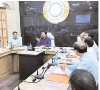
वहीं नए मतदाताओं का डाटा तैयार कर मतदाता सूची में नाम जोड़ने का निर्देश भी दिया गया। बैठक के दौरान उपायुक्त ने सभी सुपरवाइजर व बीएलओ को मतदाता पुनरीक्षण कार्यक्रम को सुपरवाइजरों को एक दिन का

1,44,51,85,91,94 वृथों का हाउस टू हाउस सर्वे पुनः कर मतदाताओं का नाम हटाने के लिए निर्दिष्ट किया। वहीं, बैठक के दौरान उपायुक्त ने विरहीर जनजाति व ट्रांसजेन्डर के लोगों को सूख धारा से जोड़ने के उद्देश्य हेतु अथवा उनके अपने अधिकार से वंचित न हो इसके तहत उपस्थित सभी सुपरवाइजर को पीडब्ल्यूडी मतदाता व विरहीर जनजाति एवं ट्रांसजेन्डर जो 18 पन्ना है उन सभी मतदाताओं का विशेष सर्वे अधिपान चलाकर मतदाता सूची में नाम जोड़ने को लेकर निर्देश दिए। बैठक के दौरान उपायुक्त ने सभी सुपरवाइजर से कहा कि डोर टू डोर सर्वे के दौरान मूल्य मतदाताओं का प्राण डाटा के आधार पर सहित या सौकाना व जनप्रतिनिधि के पंजी के अनुसार सत्यापन अर्थात् मतदाता सूची से नाम हटाने का निर्देश दिया गया