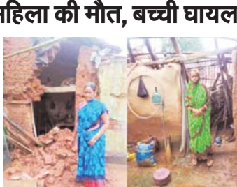
नवीन मेल संवाददाता बोकोरो। पिछले चार दिनों में ही रही मूसलाधार बारिश ने बोकोरो जिले के कई प्रखंडों में जामर कहर बरपाया है...