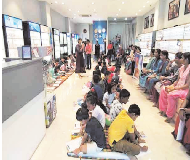
नवीन मेल संवाददाता कोडरमा। झुमरी तिलैया झंडा चौक के समीप स्थित टाइटन शोरूम में सोमवार को बच्चों के लिए चित्रकला प्रतियोगिता का आयोजन किया गया। इस प्रतियोगिता में 60 से ज्यादा बच्चे शामिल हुए। प्रतियोगिता के दौरान चित्रकला को लेकर बच्चों में काफी उत्साह देखा गया। लगभग दो घंटे की कड़ी मेहनत के बाद बच्चों ने अपनी