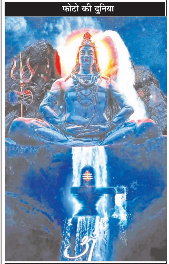
फेसबुक वॉल से

विशेष सुझाव भी दिये हैं ताकि ऐसे मामलों में सजा निर्धारित करते वक्त जज केस के तथ्यों को ध्यान में रखकर फैसला ले सके। आयोग ने कहा है कि अगर कोर्ट संतुष्ट हो कि आरोपी और पीड़ित के बीच नजदीकी संबंध थे तो कोर्ट अपने विवेक से सभी तथ्यों को ध्यान में रखते हुए पाक्सो एक्ट में निर्धारित न्यूनतम सजा से कम सजा भी दे सकता है। हालांकि कोर्ट को इसके कारण अपने लिखित आदेश में दर्ज कराने होंगे। आयोग ने कहा है कि आरोपी के साथ कोर्ट नरमी कुछ तथ्यों के आधार पर बरत सकता है।