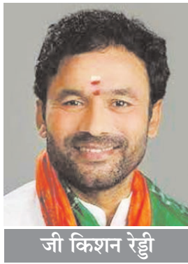
जी कृशन रेड्डी

भी जुड़ गए हैं और बाकी 5 राज्यों को जोड़ने का काम भी जल्द पूरा हो जायेगा। उहम अत्याधुनिक प्रौद्योगिकी का उपयोग करके स्थलाकृतियों से जुड़ी बाधाओं को दूर कर रहे हैं। हमने पूर्वोत्तर में ज़िरोबाम-इम्फाल रेल लाइन को दुनिया के सबसे ऊंचे तटबंध पुल का निर्माण करके विश्व रिकॉर्ड बनाया है। इसके अलावा, पर्यटन और आर्थिक क्षमता को व्यापक प्रोत्साहन देते हुए, पिछले 9 वर्षों में हवाई संपर्क सुविधा में कई गुनी वृद्धि हुई है। 2014 में केवल 9 हवाई-अड्डे थे, आज हमारे पास 17 हवाई-अड्डे हैं। अरुणाचल प्रदेश का पहला ग्रीनफील्ड हवाई अड्डा, डोनी पोली हवाई अड्डा या अरगतला में महाराजा बीर बिक्रम