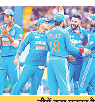
टीमें इस प्रकार है :-

एजेंसी। मोहाली। वर्ल्ड कप से पहले ऑस्ट्रेलिया के खिलाफ भारत की टीम मैचों की वनडे सीरीज शुक्रवार से शुरू हो रही है। दोनों टीमों के पास मेगा-इवेंट से पहले अपनी तैयारी और रणनीतियों को बेहतर बनाने का शानदार मौका है। पहले दो मैचों के लिए कप्तान रोहित शर्मा, विराट कोहली, कुलदीप यादव और हार्दिक पांड्या को आराम दिया गया है। इससे टीम को बाकी खिलाड़ियों का आकलन करने का मौका मिलेगा। भारत ने एशिया कप में शानदार जीत दर्ज की है। पूरी टीम दमदार फॉर्म में है लेकिन कुछ ऐसे क्षेत्र हैं जहां वो और बेहतर होने की कोशिश करेंगे। अक्षर पटेल चोटिल होने के कारण बाहर हैं। उनकी जगह रविचंद्रन अश्विन और वाशिंगटन सुंदर की ऑफ-स्पिन जोड़ी में से कौन बेहतर विकल्प होगा यह देखना दिलचस्प होने वाला है। बल्लेबाजी के मोर्चे पर ऑस्ट्रेलिया के खिलाफ सीरीज श्रेयस अय्यर और सूर्यकुमार यादव को अपनी छाप छोड़ने का मौका देगा। एशिया कप के दौरान अय्यर चोटिल होने