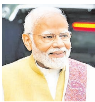
कन्वेंशन सेंटर पहुंचेंगे और काशी सांसद सांस्कृतिक महोत्सव-2023 के समापन

एजेंसी। नई दिल्ली। प्रधानमंत्री नरेन्द्र मोदी आगामी शनिवार को वाराणसी में एक अंतरराष्ट्रीय क्रिकेट स्टेडियम की आधारशिला रखेंगे। प्रधानमंत्री कार्यालय (पीएमओ) ने गुरुवार को एक प्रेस विज्ञापित जारी कर कहा कि प्रधानमंत्री नरेन्द्र मोदी 23 सितंबर को वाराणसी का दौरा करेंगे। दोपहर लगभग 1:30 बजे प्रधानमंत्री वाराणसी में अंतरराष्ट्रीय क्रिकेट स्टेडियम की आधारशिला रखेंगे। अपराह्न लगभग 3:15 बजे, प्रधानमंत्री रुद्राक्ष अंतरराष्ट्रीय सहयोग और