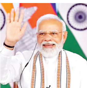
इस योजना की शुरूआत कारीगरों और श्रमिकों को प्रोत्साहन देने के लिए ही किया जा रहा है। इसका उद्देश्य पारंपरिक शिल्प कोशल में

नवीन मेल संवाददाता। रांची पूरे देश में रविवार को 70 स्थानों पर पीएम विश्वकर्मा योजना लॉच होगा। साथ ही रांची और पूर्वी सिंहभूम में भी यह योजना को लॉच किया जाएगा। इससे लेकर कारीगर और विश्वकर्मा समाज में उत्साह का माहौल बना हुआ है। केंद्र सरकार की इस योजना से राज मिस्त्री, लोहार, धोबी, कुम्हार, फूलों का काम करने वाले, ताला चाबी बनाने वाले, मूर्तिकार, मछली का जाल बुनने वाले आदि को लाभ मिलेगा।