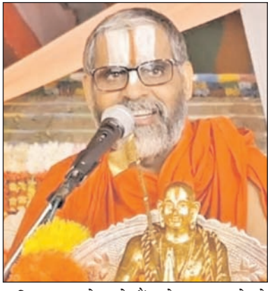
कटिपर कर धरे खड़े हैं। जो कुछ चाहते हो उसके वही तो दाता हैं। उनके चरणों में जाकर लिपट जाओ! वह जगतस्वामी तुमसे कोई मील

वासना है, नारायण! मेरी यह कामना पूरी करो। पर निंदा में बड़ी रूचि थी, दूसरों की खूब निंदा की, परपोकार न मैंने किया; न दूसरों से कभी कराया। दूसरोंको पीड़ा पहुँचाने में कभी दया न आयी। ऐसा व्यवसाय किया जो न करना चाहिये और उससे पाया तो क्या, अपने कुटुम्ब का भार होता फिरा। तीर्थों की कभी यात्रा नहीं की, केवल इस पिंड के पालन करने में ही हाथ-पैर मारता रहा। मुझसे न संत-सेवा बनी, न दान-पुण्य बना, न भगवान की मूर्ति का दर्शन और पूजन-अर्चन ही बना। कुसङ्ग में पड़कर अनेक अन्याय और अधर्म किये। मैंने अपना-आप ही सत्यानाश किया, मैं अपना- आप ही वैरी बना। भगवान! तुम दयाके निधान हो, मुझे इस भनसागर के पार उतारो! भव सागर को तैर कर पार करते हुए चिंता किस बातकी करते हो? उस पार तो 'वह'