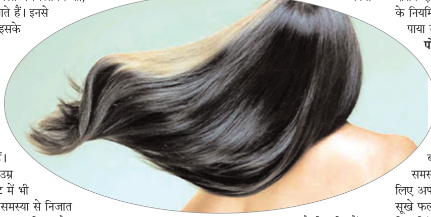
डेली रूटीन में शामिल करने से स्कैल्प में ब्लड सर्कुलेशन को बढ़ावा मिलता है। साथ ही हेयर फॉलिकल्स बढ़ाने में मदद मिलती है। इस आसन को करने के लिए सबसे पहले

रचना चाहिए। स्कैल्प पर अर्लाई करें मेथी : बाल झड़ने की समस्या को रोकने के लिए बालों पर मेथी का इस्तेमाल करें। एंड्रोजन हार्मोन के बढ़ने से बाल ज्यादा टूटने लगते हैं। ऐसे में मेथी एंड्रोजन हार्मोन को कंट्रोल कर बालों को हेल्दी बनाने के साथ हेयर ग्रोथ में भी मदद करता है। इसलिए सप्ताह में कम से कम एक बार मेथी का पेस्ट बालों में अर्लाई करें। कुछ लोग मेथी पानी का भी सेवन करते हैं। इससे आपके बाल धीरे-धीरे ग्रोथ करने लगेंगे। बता दें कि मेथी की तासीर गर्म होती है। ऐसे में आपको मेथी पानी का अधिक सेवन करने से बचना चाहिए। सिर में लगाएं अरंडी का तेल : गंजेपन की समस्या को कम करने के लिए बालों में अरंडी का तेल लगाया फायदेमंद होता है। 2 चम्मच अरंडी के तेल में 1 चम्मच नारियल का तेल मिलाकर मिलाएं। फिर इस तेल को हल्का सा गर्म कर लें। इसके बाद हल्का गुनगुना तेल स्कैल्प पर अर्लाई करें। बता दें कि अरंडी के तेल में ओमेगा-6 एसेंशियल फैटी एसिड पाया जाता है। जो बालों को जड़ों से मजबूत बनाता है। इस उपाय से डैंड्रफ की समस्या भी कम होती है।