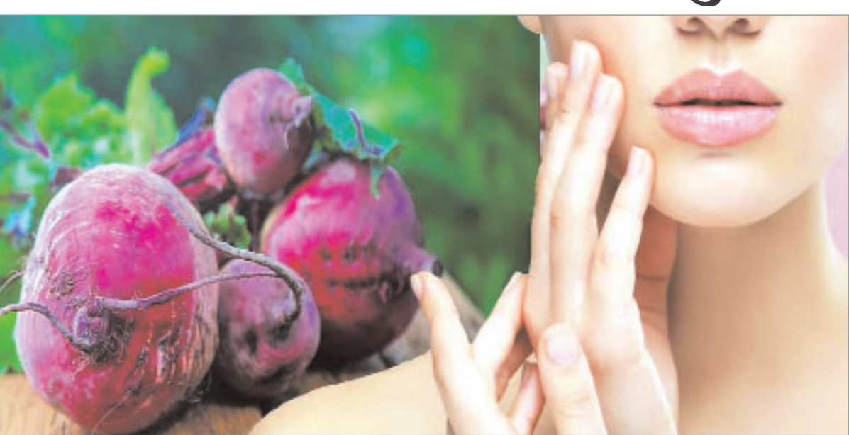
टैनिंग दूर करने के लिए चुंकंदर अगर आपको इन दिनों टैनिंग की समस्या का सामना करना पड़ रहा है तो ऐसे में चुंकंदर का इस्तेमाल करना यकीनन काफी अच्छा माना जाता है।