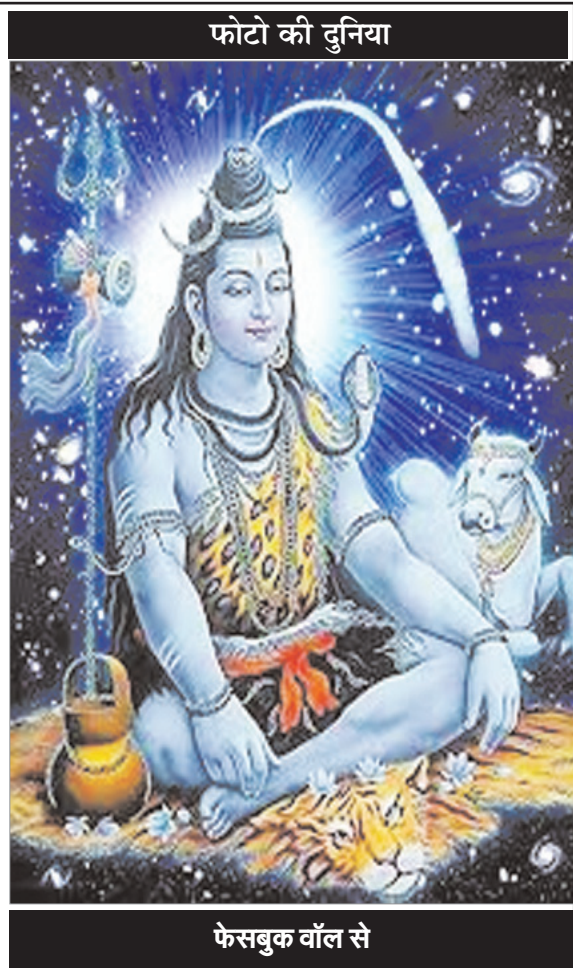
फोटो की दुनिया

जिनमें सब कुछ सकारात्मक है नेगेटिव कुछ ही नहीं। कुलना कीजा विवेकानंद के रूप में उस एक नौजवान को। गुलामी की छाया न जिसके विचार में थी, न व्यवहार में थी और न वाणी में थी। भारत मां की जागृत अवस्था को जिसने अपने भीतर पाया था। ऐसा एक महत्पुरुष जो पल-दो पल में विश्व को अपना बना लेता है। जो पूरे विश्व को अपने अंदर समाहित कर लेता है। जो विश्व को अपनत्व की पहचान दिलाता है और जीत लेता है। वेद से विवेकानंद तक, उपनिषद से उपग्रह तक हम इसी परंपरा में पले बढ़े हैं।