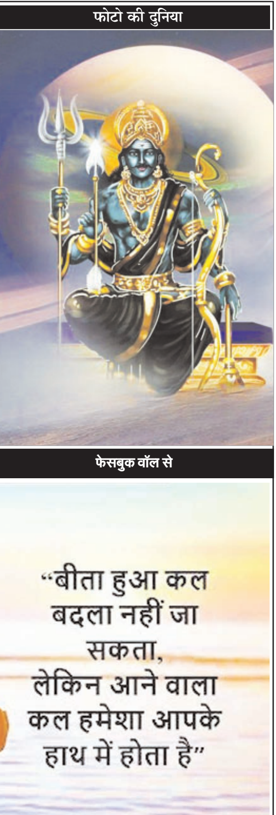
फोटो की दुनिया

कमाई का एक तिहाई हिस्सा सरकार को देती हैं। इसके अलावा दूसरे तरीकों से पुलिस-प्रशासन, नगर निगम व अन्य विभागों को चढ़ावे के रूप में दिया जाता है। कुल-मिलाकर शिक्षा की आड़ में धंधा कैसे पनपता है, उसका सजीव उदाहरण इस समय कोटा बना हुआ है। सरकारी आंकड़ों के मुताबिक इस वक्त करीब पांच फीस छात्र मैडिकल, जेईई, इंजीनियरिंग व अन्य विभिन्न प्रतियोगी परीक्षाओं की तैयारियां कर रहे हैं। लेकिन इनकी सुरक्षा पूरी तरह रामभरोसे है। अभी कुछ महीनों पहले दिल्ली के मुखर्जी नगर में दर्दनाक हादसा हुआ था।