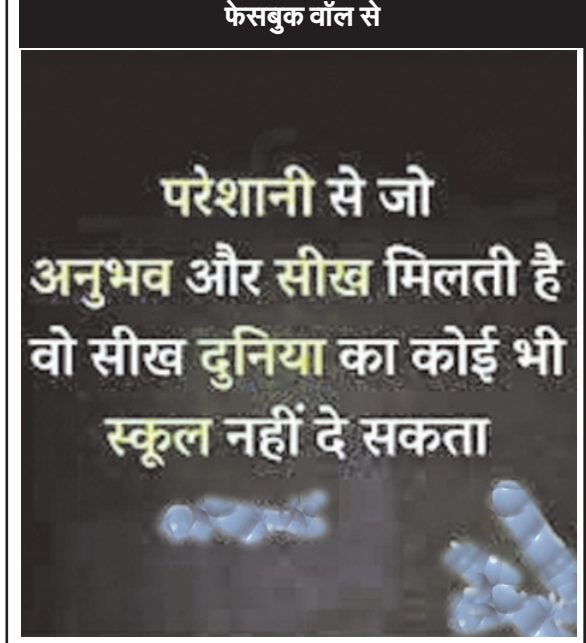
फेसबुक वॉल से

परेशानी से जो अनुभव और सीख मिलती है वो सीख दुनिया का कोई भी स्कूल नहीं दे सकता