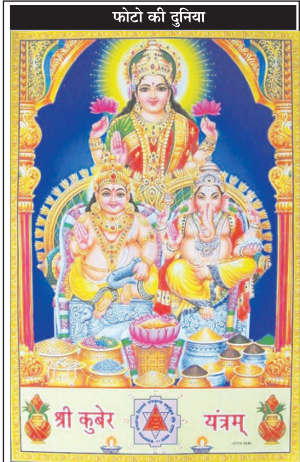
फोटो की दुनिया

बर्नी। वह घर से बिना बताए चली गईं। इस मामले में पहले तो घरवाले गुमशुदगी की एफआईआर करा देते हैं लेकिन कुछ दिनों बाद उनको शादी से संबंधित दस्तावेज कूरियर कर दिया जाता है। अब तीसरे एंगल पर बात करें तो देश के दबंग, गरीबों को अधिक व्याज पर पैसा देते हैं। जब वह लोग पैसा चुका नहीं पाते तो उनकी घर की बहन-बेटियों को उठा लेते हैं। देश के कई राज्यों में यह दस्तूर है। यह आंकड़े सरकारों की कार्यशैली पर भी सवाल उठाते हैं।