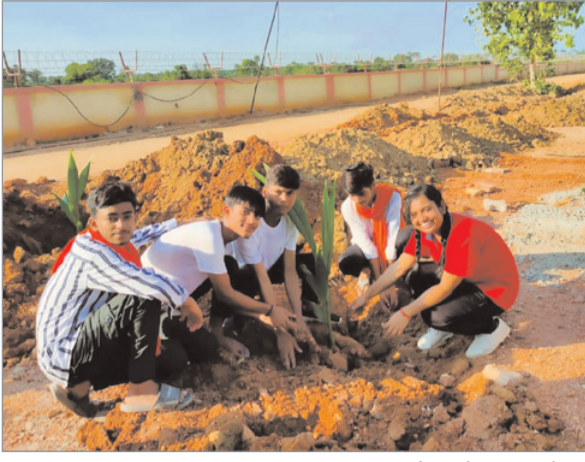
मिठाई खिलाकर स्वागत किया। मौके पर प्राचार्य की धर्मपत्नी श्रीमती

नवीन मेल संवाददाता हुसैनाबाद। पलामू जिले के हुसैनाबाद में जवाहर नवोदय विद्यालय जपला टूके के विद्यार्थियों एवं शिक्षक कर्मियों ने नवनिर्माण हो रहे नवे जवाहर नवोदय विद्यालय जपला टूके के मुसली पहाड़ी लंगरकोट स्थित पहुंचकर 100 से अधिक छात्राचार व फलदार वृक्ष लगाये। इस दौरान विद्यालय के सभी छात्र-छात्राओं एवं शिक्षक कर्मियों ने विद्यालय भवन का अवलोकन किया। बच्चों ने पहाड़ियों के मनोरम दृश्य में पूरी तरह से आधुनिक भवनों में घूम घूम कर खूब लुप्त उठाया। इस दौरान निर्माण कर रही कंपनी ने सभी बच्चों को वृक्ष लगाने के उपलक्ष्य में