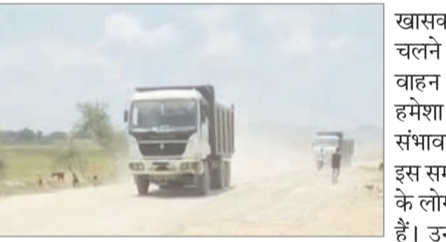
की मांग की गई है। परंतु अभी तक मरम्मत नहीं किया गया है। वहीं धूलकण से बचाव के लिए कोई प्रयास नहीं किया जा रहा है।