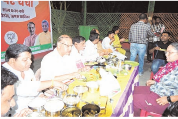
नवीन मेल संवाददाता हजारीबाग। हजारीबाग सांसद सह अध्यक्ष वित्त संबंधी स्थायी संसदीय