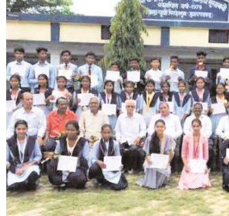
कहा कि उन्होंने पहाड़ के साथ खेल को भी अपना कैरियर के रूप में चुना इसलिए उनका विषय में डंका बज रहा है। खेल में लागाव रखने वाले बच्चे खेल के क्षेत्र में भी अपना कैरियर बना