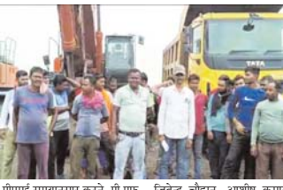
पीएमई समवायन करने, पी एक कटौती सहित श्रम कानून के अंतर्गत अन्य मांगों को पूरा करने की मांग की। मजदूरों ने शुक्रवार को सुरक्षा में अन्देड़ो व श्रम कानून के उल्लंघन का आरोप लगाया...