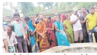
नवीन मेल संवाददाता हजारीबाग। इचाक क्षेत्र के मोकतमा गांव में शुक्रवार को मां और उसके चार साल के बच्चे का शव कुएं से बरबाद किया गया है...