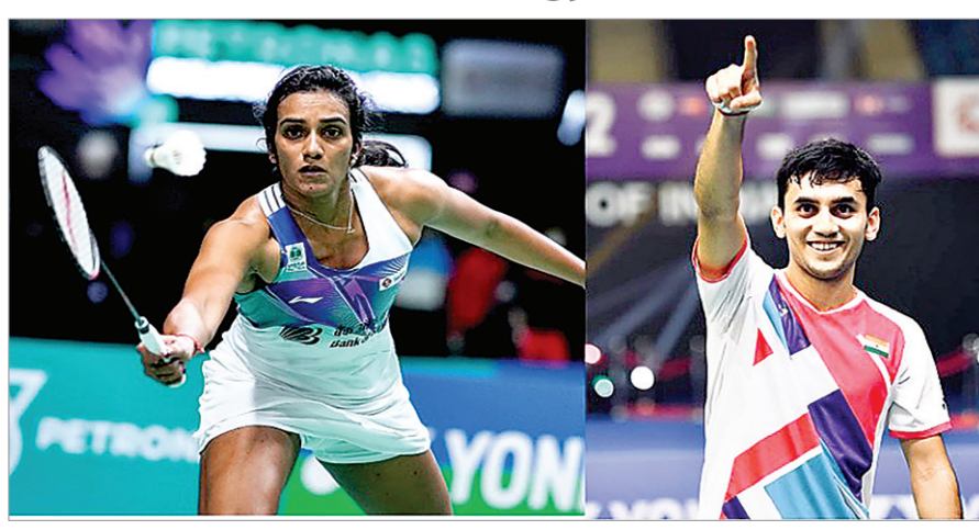
काफी अच्छा मैच खेला। मैं अपने प्रदर्शन से खुश हूँ। वहीं दो बार की ओलंपिक पदक विजेता पीवी

में इस 21 साल के खिलाड़ी ने कांस्य पदक जीता था। अब रविवार को फाइनल में उनका सामना चीन के लि शि फेंग से होगा जिनके खिलाफ उनका जीत का रिकॉर्ड 4-2 का है। सेन ने कहा, काफी खराब शुरूआत हुई, मैं शटल पर अच्छी तरह नियंत्रण नहीं बना पाया। जैसे ही मैं लय में आय तो बेहतर होता गया। 'परफेक्ट नेटप्ले' अहम रहा और हम दोनों ऐसा ही करने की कोशिश कर रहे थे।' उन्होंने कहा, आखिर में मैंने नेट पर नियंत्रण बना लिया और स्मैश भी अच्छे रहे। तकनीकी रूप से