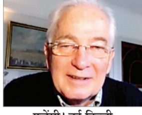
एजेसी। नई दिल्ली

लॉर्ड्स इंग्लैंड के पूर्व कप्तान डेविड गॉवर ने दूसरे एंजेलो टेस्ट के पांचवें दिन लॉर्ड्स में मेरिलबोन क्रिकेट क्लब (एमसीसी) के कुछ सदस्यों के ऑस्ट्रेलिया के बाएं हाथ के सलामी बल्लेबाज उस्मान ख्वाजा के प्रति व्यवहार को बिल्कुल गलत और बेहद विडंबनापूर्ण बताया है। लॉर्ड्स में पांचवें दिन के खेल में एलेक्स कैरी ने जॉनी बेयस्टो को स्टंप किया था, जब बल्लेबाज क्रिज से बाहर निकल गए थे, उसके बाद लंच ब्रेक के दौरान, एमसीसी के सदस्यों ने ऑस्ट्रेलियाई टीम के साथ घक्का-मुक्की की, मजाक उड़ाया और उनकी आलोचना की। एमसीसी के कुछ सदस्यों ने