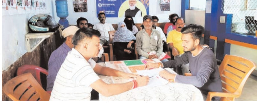
जीवन बीमा, ग्रामीण डाक जीवन बीमा अब घर घर में जाकर योजना को बताया जायेगा और